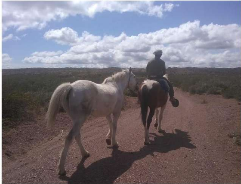
Imagen 3: Paisaje del zonas de El Cuy