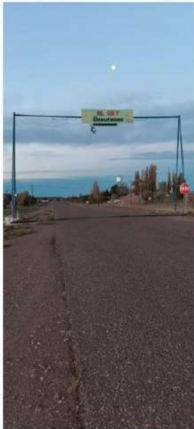
Imagen 2: Ingreso a la localidad de El Cuy