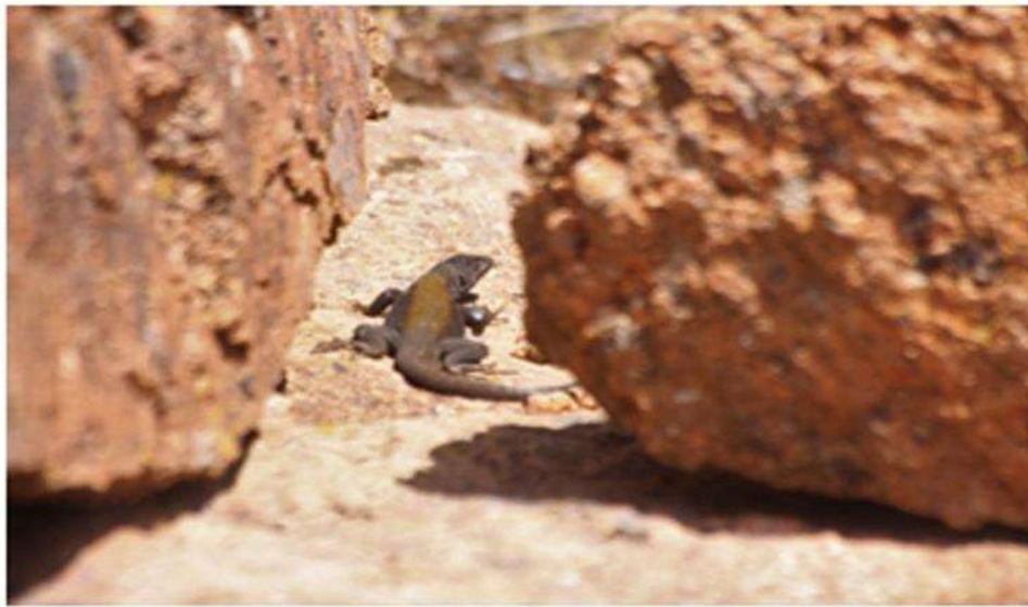
Imagen 5. Liolaemus shitán (lagarto satánico)

Grandes extensiones sin contaminación lumínica hacen del cielo nocturno una propuesta para aficionados a la astronomía y el paisaje nocturno. La biodiversidad hace que El Cuy y parajes aledaños sean destino para estudios y observación de aves y especies de reptiles de gran valor científico, como el Liolaemus shitán (lagarto satánico), entre otros y desafíos artísticos para fotografía.