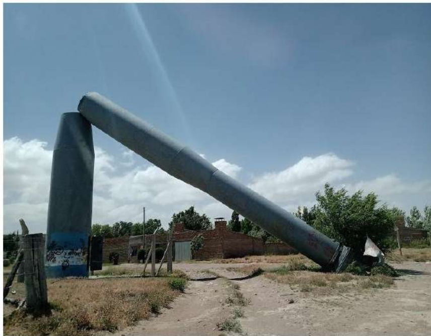
Imagen 4: Condiciones actuales del Generador Eólico

La Interpretación del Patrimonio sirve de apoyo a la planificación turística. Facilita el acercamiento entre turista y el territorio a visitar, ya que colabora en la difusión y comprensión de los valores y significado del área interpretada. A partir de los servicios y equipamientos de interpretación se consigue la satisfacción del visitante, no se