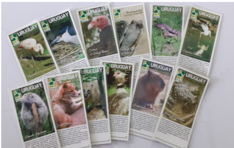
Figura 1. Fichas que se les entregaba a los estudiantes que visitaban el museo para la realización de la actividad.

Para la confección de las tarjetas se utilizaron los nombres comunes de las especies. Aunque estos nombres no carecen de ambigüedad y varían en diferentes contextos (e.g., geográficos, lingüísticos), se trata de los nombres más frecuentes en la bibliografía no especializada y en la cultura uruguaya en general. Esto es muy importante, ya que el público al cual iba dirigido este trabajo consistía en estudiantes de nivel primario y secundario, y no estudiantes universitarios de carreras biológicas o afines, familiarizados con los nombres científicos de las especies. Los análisis estadísticos se realizaron utilizando el programa PAST PAleontological Statistics Version 4.07b (Hammer et al. , 2001).