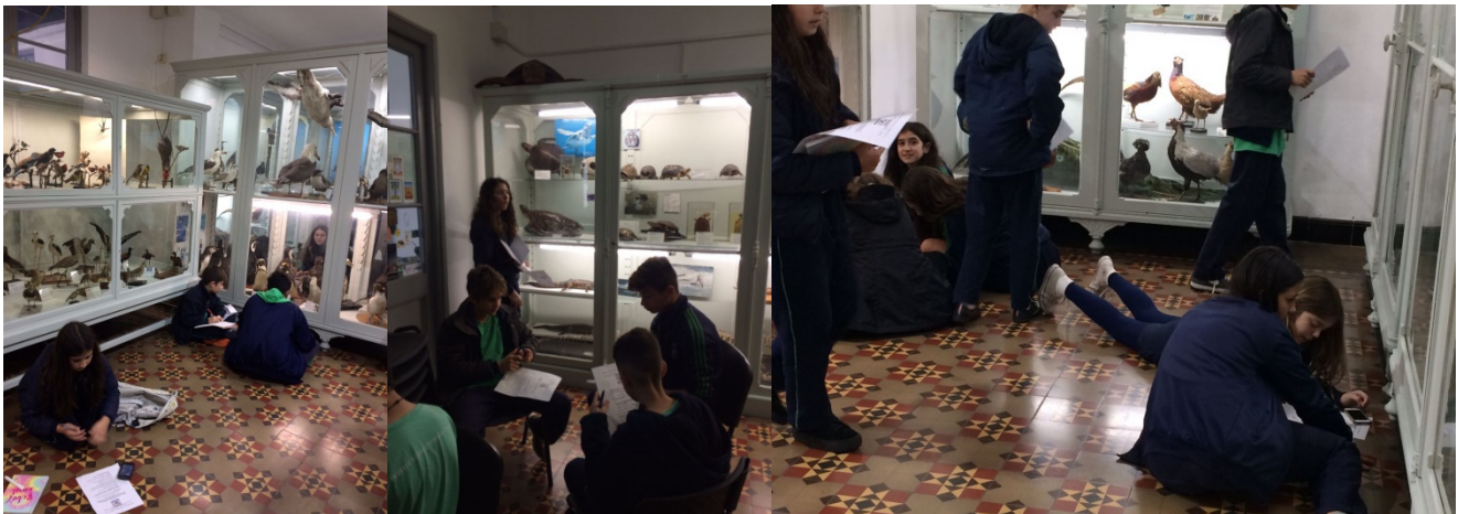
Figuras 2. Estudiantes mediante el desarrollo de la actividad de búsqueda de información de las especies que les tocaron en las fichas. Se observa una postura activa con apropiación del espacio del museo.

Otro aspecto analizado fue la posible existencia de vínculo entre la edad de los participantes y el número de especies mencionadas, lo cual mostró la no existencia de correlación entre ambas variables, tanto al analizar las respuestas antes ( r^2 = 0,115 ) como después de la visita ( r^2 = 0,0025 ).