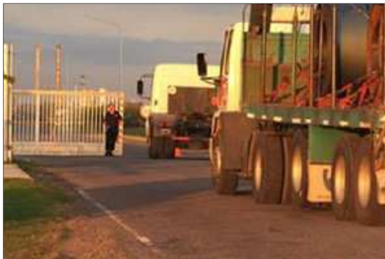
Fotografía 3b. Bobinas de chapa de laminado en frío