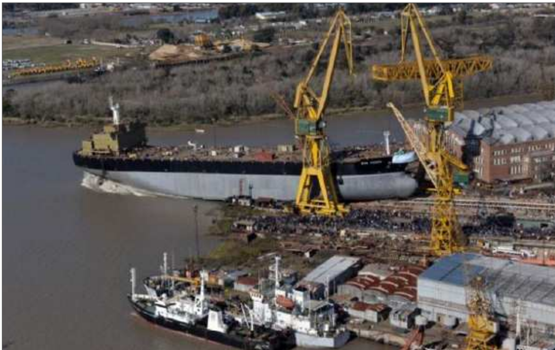
Fotografía 2b. Astillero Río Santiago