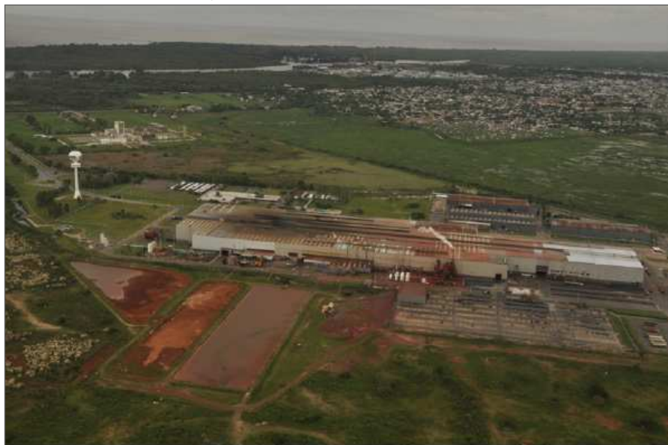
Imagen 4. Planta industrial TERNIUM-SIDERAR