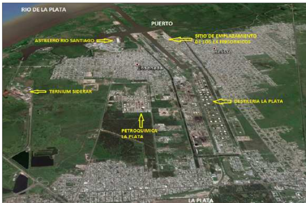
Imagen 1. Ubicación de las Grandes Empresas industriales