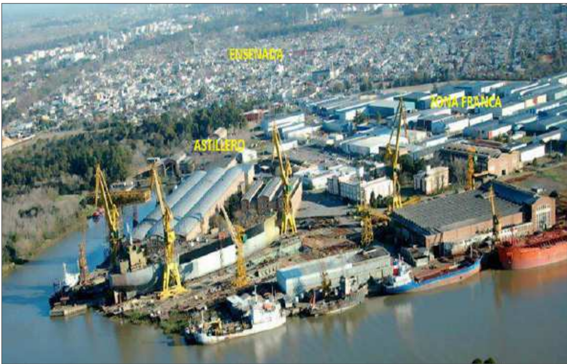
Fotografía 1. Astillero Río Santiago (ARS) y Zona Franca