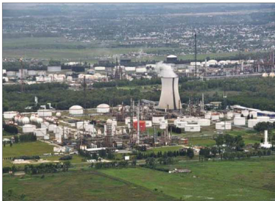
Fotografía 4. Petroquímica General Mosconi