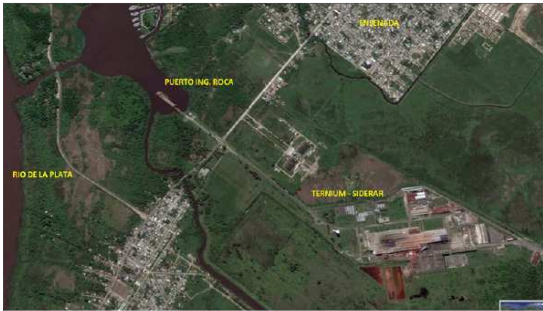
Imagen 3. Ubicación de la Planta industrial Ternium-SIDERAR