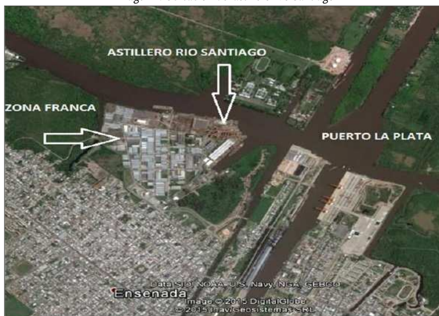
Imagen 2. Ubicación del astillero Río Santiago

El intento de privatización de la empresa a principios de los '90 llevó a un ciclo de protestas laborales con huelgas, movilizaciones, toma de la empresa (Frassa, 2014). En el período más álgido de lucha por parte de los trabajadores para evitar la privatización de la empresa, la planta industrial fue ocupada por fuerzas de la Gendarmería Nacional.