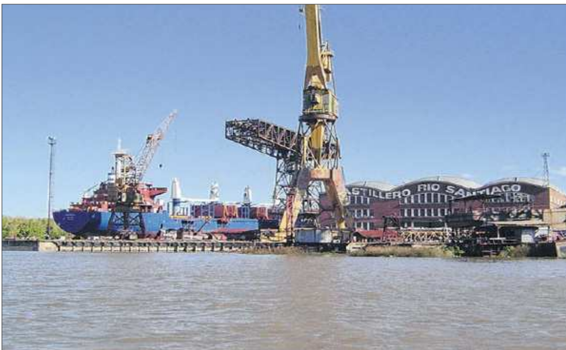
Fotografía 2a. Astillero Río Santiago