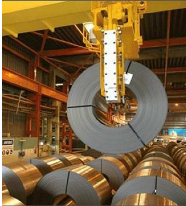
Fotografía 3a. Bobinas de chapa de laminado en frío