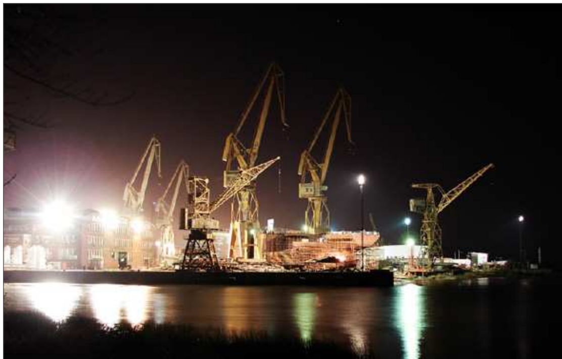
Fotografía 2c. Astillero Río Santiago