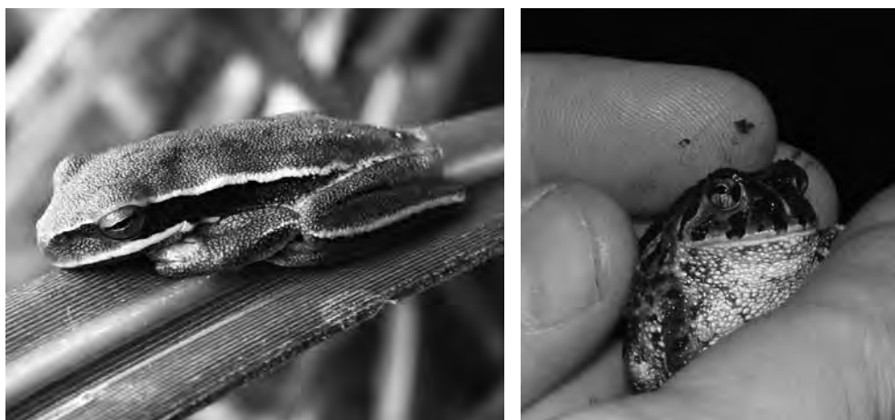
Figura 3. Dos especies de anfibios comunes en dunas: a la izquierda, Hypsiboas pulchellus . Derecha, Odontophrynus americanus .