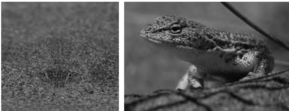
Figura 2. Especie amenazada de la herpetofauna de las dunas bonaerenses: Liolaemus multimaculatus .

La situación es muy delicada en general para toda la biodiversidad de anfibios y reptiles que habitan en dunas, y de seguir por este camino es altamente probable que en un corto plazo de tiempo, con la pérdida de grandes áreas costeras, se produzca la consecuente extinción de poblaciones locales de varias especies, principalmente de aquellas especializadas a la vida en la arena, como algunas lagartijas y culebras arenícolas. Sin embargo, aún quedan esperanzas de que políticas integradoras, e iniciativas orientadas a la creación y manejo de nuevas áreas protegidas, promuevan la generación de santuarios en donde se protejan los ensambles de anfibios y reptiles de la fauna costera autóctona.