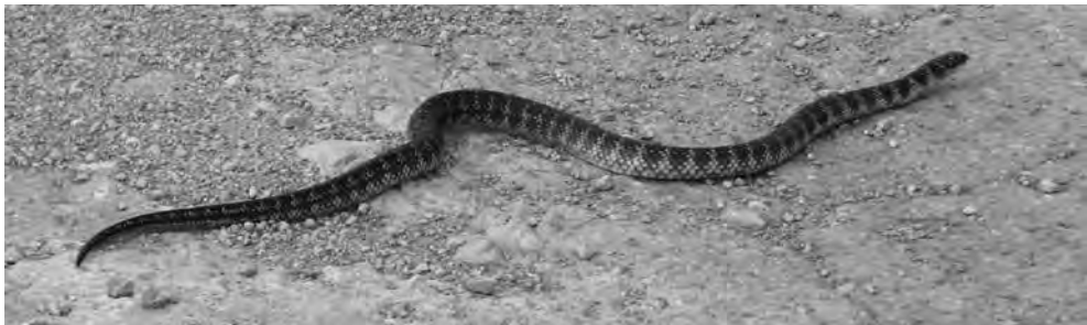
Figura 5. Erythrolamprus poecilogyrus .