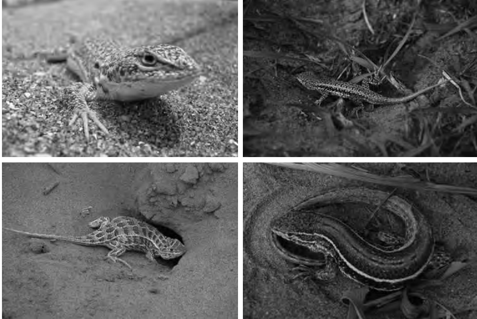
Figura 4. Lagartijas arenícolas típicas de las dunas bonaerenses. Arriba izquierda, Liolaemus multimaculatus . abajo izquierda, Stenocercus pectinatus . arriba y abajo derecha, Liolaemus wiegmanni y Liolaemus gracilis respectivamente.