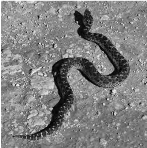
Figura 7. Bothrops ammodytoides .