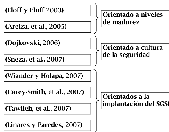
Fig. 1 Propuestas de SGSI orientadas a PYMES.

En el estudio de la literatura existente se han hallado diferentes intentos (ver Figura 1) para resolver la problemática de aplicar los modelos SGSI tradicionales en la PYME centradas en algunos aspectos de los SGSIs. En las siguientes sub-secciones se muestran algunos de los modelos de madurez para la gestión de la seguridad que se están desarrollando orientados a PYMES y que, si bien no resuelven los problemas existentes, sí se ha considerado que tienen aportaciones interesantes que deben ser analizadas. Entre ellas podemos destacar: