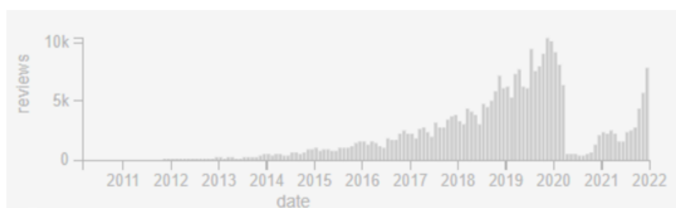
FIGURA 1 Cantidad de reseñas de los huéspedes en la plataforma Airbnb en Ciudad de Buenos Aires, años 2011-2021

Fuente: Inside Airbnb (recuperado 11/3/22)