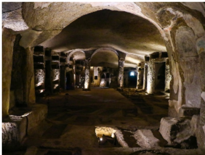
FIGURA 2. Catacumbas de San Gennaro

El proyecto bajo análisis se basa en la promoción turística del patrimonio cultural del barrio, hay para visitar principalmente las Catacumbas de San Gennaro, un cementerio de los siglos II y III d.C, y que con los años se convirtió en el más grande de todo el sur de Italia y un destino de peregrinación importante (Lamperti, 2019). Allí se hallan restos de Sant' Agrippina, la primera patrona de Nápoles y el lugar, como otros de la ciudad, fue usado durante la Segunda Guerra Mundial como refugio (Klaos, 2019).