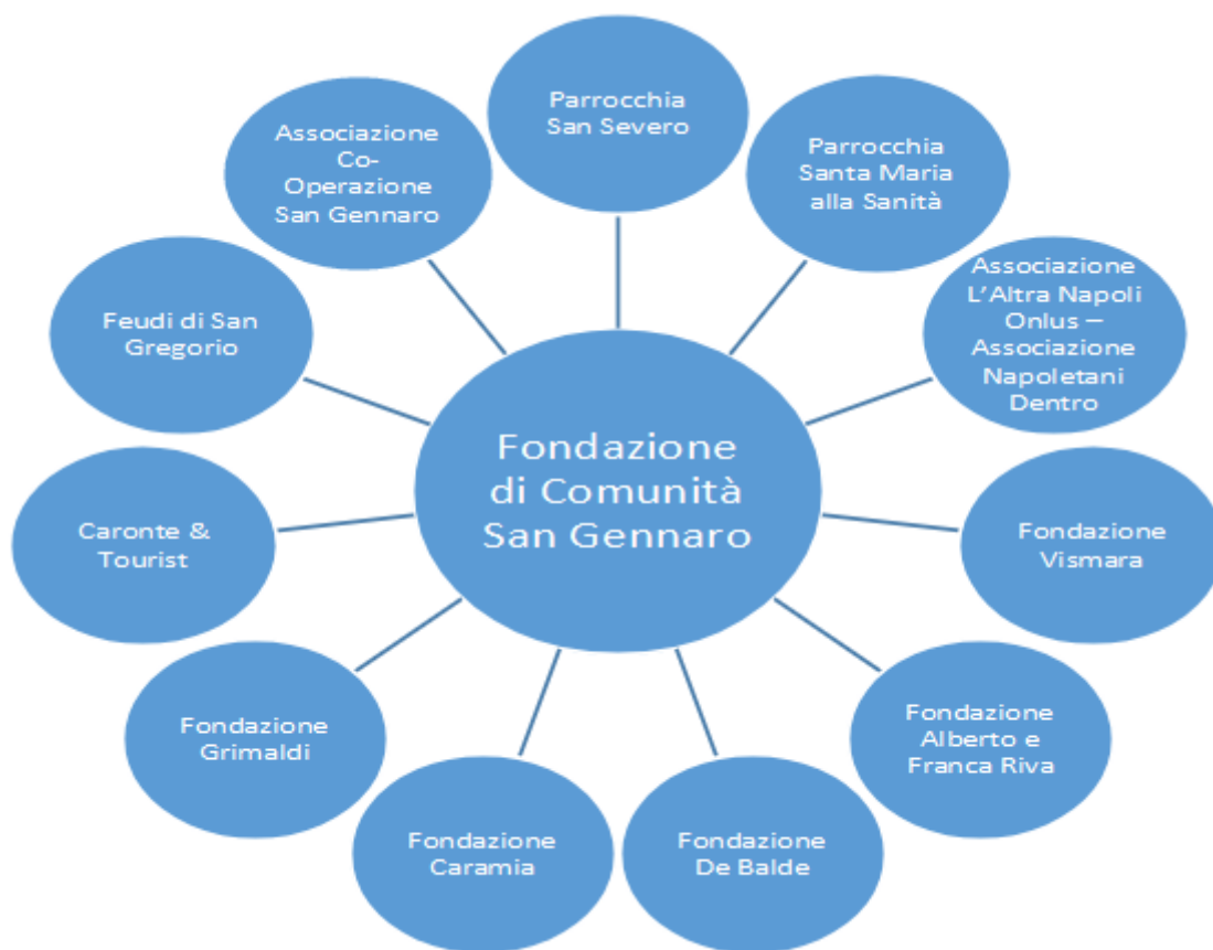
FIGURA 5 Socios Fundadores de Fondazione di Comunità San Gennaro que figuran en la Página oficial

De a poco se fue conformando un modelo de financiamiento vía proyectos públicos o mediante patrocinios privados, gestionados por las diversas asociaciones que, en 2014, como se analiza más abajo, fueron integradas en la Fondazione di Comunità San Gennaro. La prensa habló de desacuerdo con el Vaticano, principalmente respecto al porcentaje de ingresos económicos de las catacumbas que exigía la Pontificia Comisión de Arqueología Sacra ya que el mencionado patrimonio arqueológico es propiedad del Vaticano (Cernuzio, 2018).