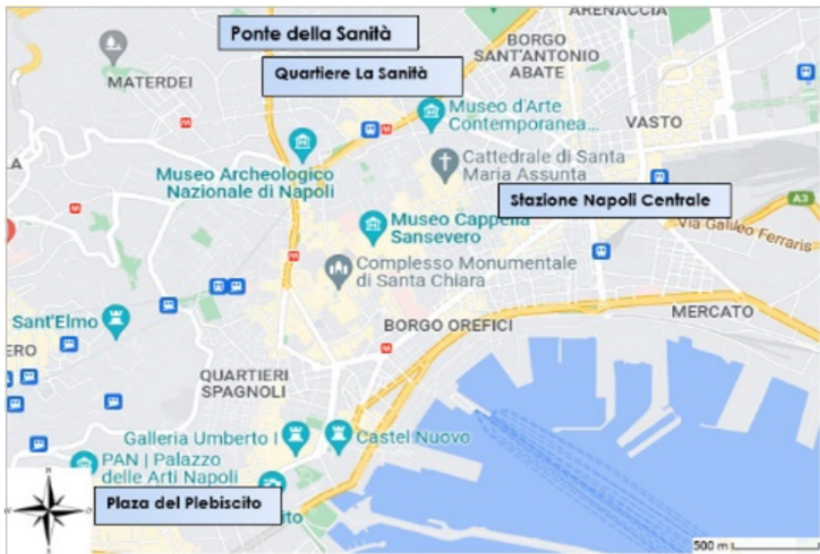
FIGURA 1. Mapa de Nápoles

Los sitios atractivos para el turismo en el barrio son las Catacumbas de San Gennaro y la Iglesia Madre del Buon Consiglio (o de San Genaro), primer hito si se desciende desde Capodimonte; la Iglesia de Santa María de la Vitta al oeste si se baja por el ascensor; y más allá el Cementerio delle Fontanelle; la plaza al este, las Catacumbas de San Gaudioso junto a la Iglesia de Santa María della Sanità y más allá la Basílica de San Severo.