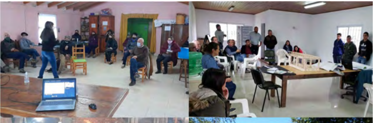
Figura 4: Reuniones Interactorales

El trayecto de la Resignificación Simbólica del hábitat y su resultado devenido en un nuevo orden, la Co-construcción, supone la conformación de redes de actores e instituciones de la comunidad que tiene a su cargo las decisiones colectivas y la definición de las propuestas, que operan en sendas reuniones y encuentros donde se comparte información como base del potencial decisorio, supone el reconocimiento territorial de base sustentable considerando los bienes materiales como tangibles productivos junto a la intangibilidad del saber que anida en la comunidad y es parte del acervo resolutivo; supone los espacios productivos en los que el conocimiento es convidado de manera solidaria, asociativa y complementaria y supone un producto tecnológico que es propiedad colectiva del conglomerado de la Red que permite materializar un hábitat que se construye.