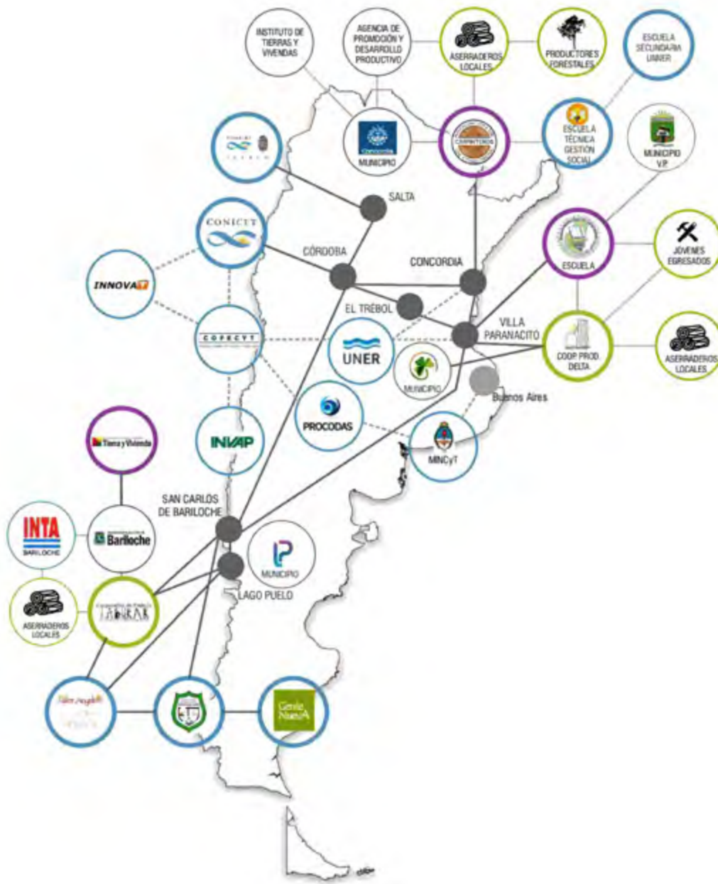
Figura 2: Red Federal Productiva: Co-construir Hábitat

Circulan en esa Red Federal Productiva experiencias y lecciones aprendidas que se convidan como parte del capital cognitivo alternativo engendrado en otras formas de conocer, hacer y sentir que tienen como su principal valor el reconocimiento del otro, en su ser cognoscente y espiritual, logrando esta circulación a través de estrategias comunicacionales múltiples que ponen en un equilibrio armónico el acceso al conocimiento plural y sus adaptaciones locales en una franca resiliencia de conocimientos.