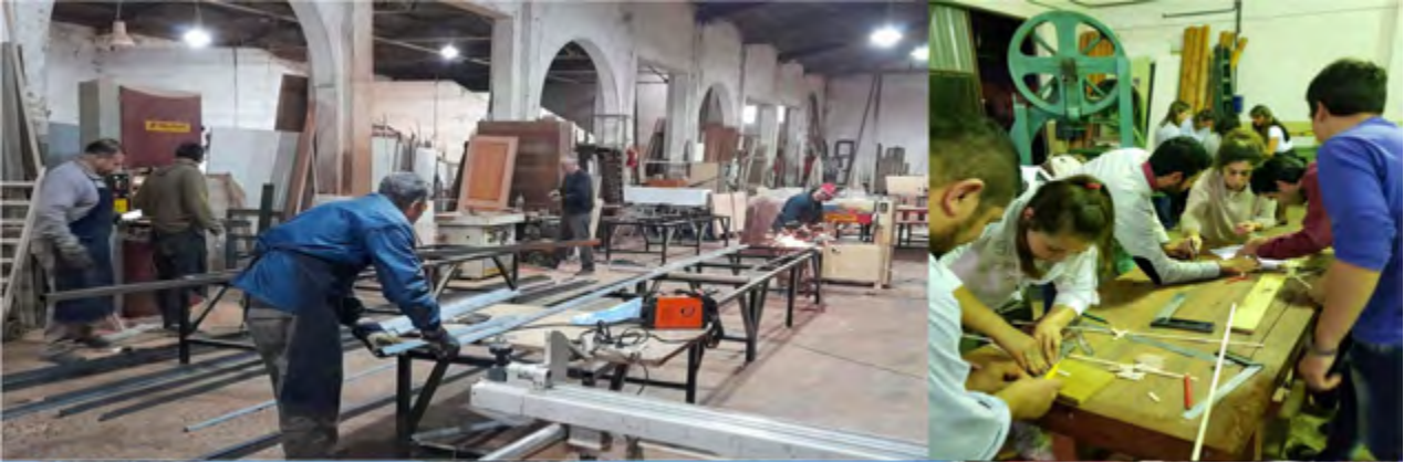
Figura 3: Talleres Productivos