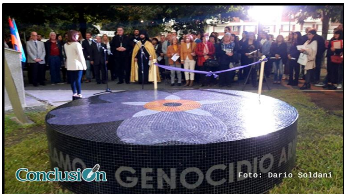
Figura N° 4: Memorial del genocidio armenio en Rosario