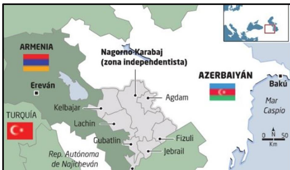
Figura N° 1: Localización de Nagorno-Karabaj