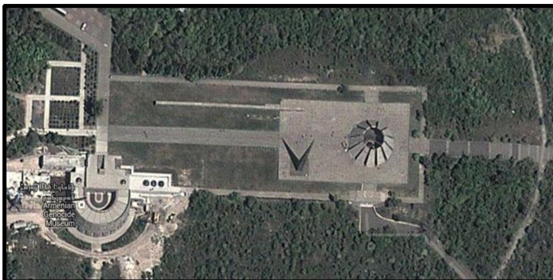
Figura N° 5. Imagen satelital del memorial del genocidio en Ereván, Armenia