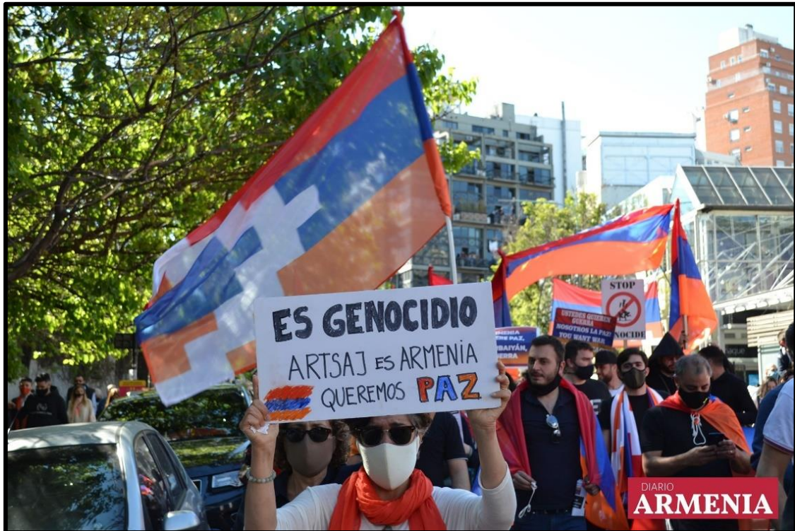
Figura Nº 8: Marcha de la comunidad armenia de Argentina - 10/10/20

Canadá, Estados Unidos, entre otros países fueron escenario de las reivindicaciones en favor de la paz de los ciudadanos de origen armenio (Figuras Nº 8 y 9).