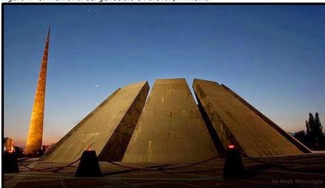
Figura N° 6. Memorial del genocidio en Ereván, Armenia