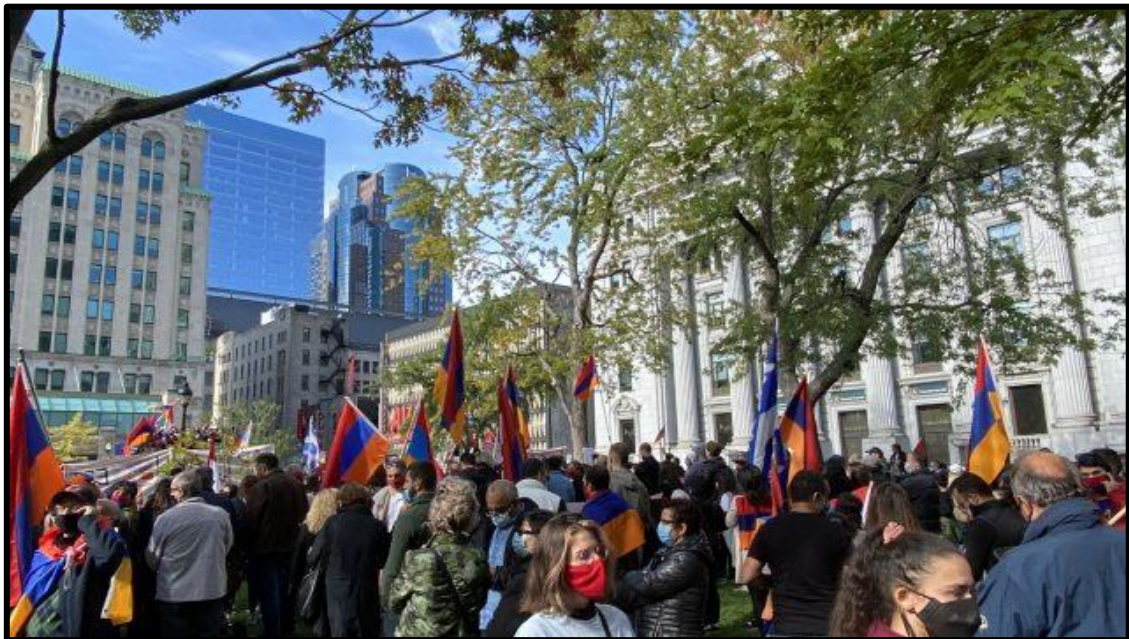
Figura Nº 9: Manifestación de armenios de Montreal "contra el terrorismo y las agresiones de Azerbaiyán"