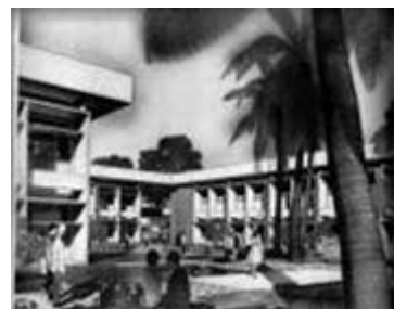
Universidad de Bagdad. 1960-62. W. Gropius + TAC