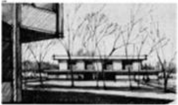
Plan general Britz-Buckow-Rudow, Berlín 1959. W. Gropius + TAC