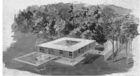
Casa en Mar del Plata. 1943. A. Williams