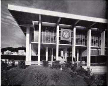
Embajada de EE. UU. en Atenas. 1956. W. Gropius + TAC

Existen otros proyectos que pueden tenerse en cuenta como antecedentes con muchas estrategias de proyecto similares, dentro de estos podríamos mencionar la Estación de Servicio en Avellaneda, 194-1955, en la cual Williams separa del nivel cero el volumen que aloja los servicios y el Monumento en Berlín, 1964 en el cual el arquitecto argentino realiza al igual que en la Embajada un proyecto con diferentes estearatos: un basamento, en este caso de hormigón armado, un nivel 0 dedicado al acceso y un prisma elevado que alberga el resto del programa.