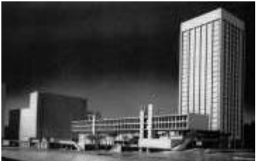
Centro médico del Hospital infantil, Boston. 1962 W. Gropius + TAC