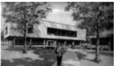
Fábrica de porcelana, Baviera. 1965. W. Gropius + TAC