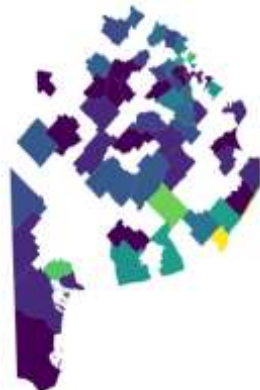
Figura 1 – Avisos Booking