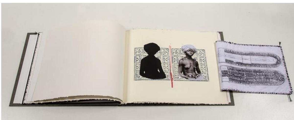
Rosana Paulino, ¿História natural? (2016), libro de artista.

Una tela con un mapa de África, cosido al papel, cubre parte de la siguiente hoja. Al abrir este paño, se muestra la impresión del esquema de un barco que llevaba personas esclavizadas, como mencionamos antes, un “navio negreiro”. Sobre la hoja de papel que se encuentra debajo se ven dos azulejos sobre los cuales se encuentra la misma imagen de la persona africana reproducida en “As gentes”, pero esta vez con su rostro a la vista, del lado derecho, y como una imagen completamente negra, cuyos contornos revelan que se trata de la misma figura, del costado izquierdo. En esta última, su opacidad indica que, según expresó Paulino (thefrankmuseum, 9 de febrero de 2019), más que personas, eran “sombras”. Estas imágenes completan su significado con el mapa del continente africano y del barco esclavista. Entre las dos imágenes, otra vez una tinta roja chorrea señalando la presencia de sangre.