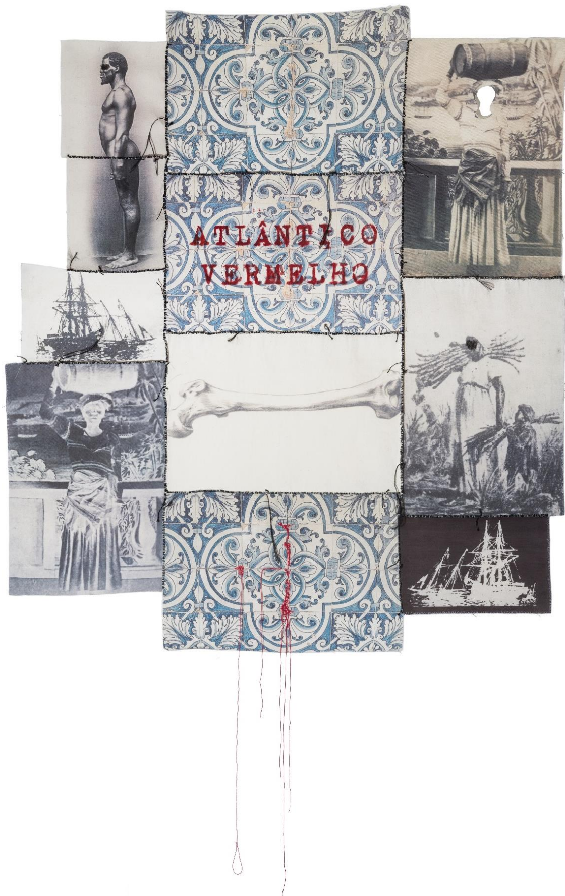
Rosana Paulino. Atlântico Vermelho (2017), técnica mixta.