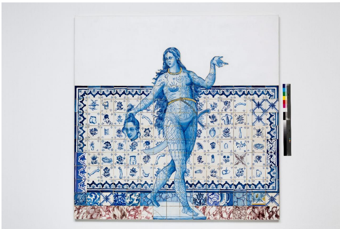
Adriana Varejão, Figura de convite III , série Proposta para uma catequese (2005), óleo sobre tela.