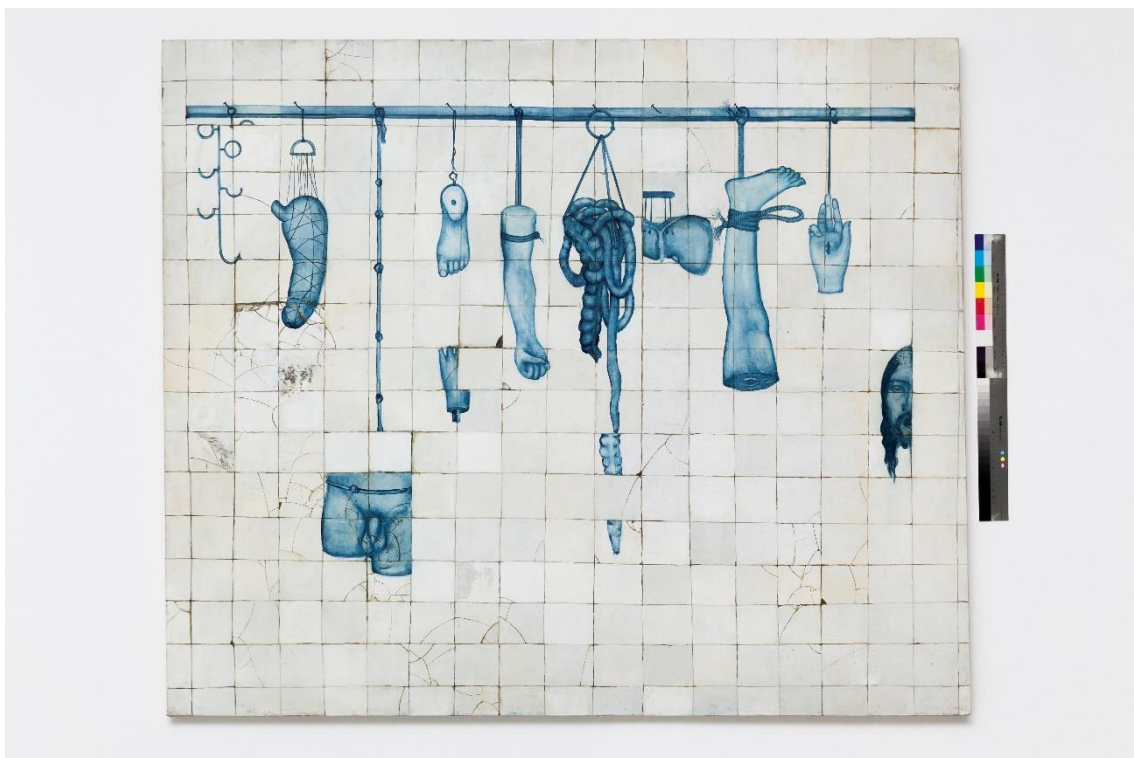
Adriana Varejão, Varal, série Proposta para uma catequese (1993), óleo sobre tela.