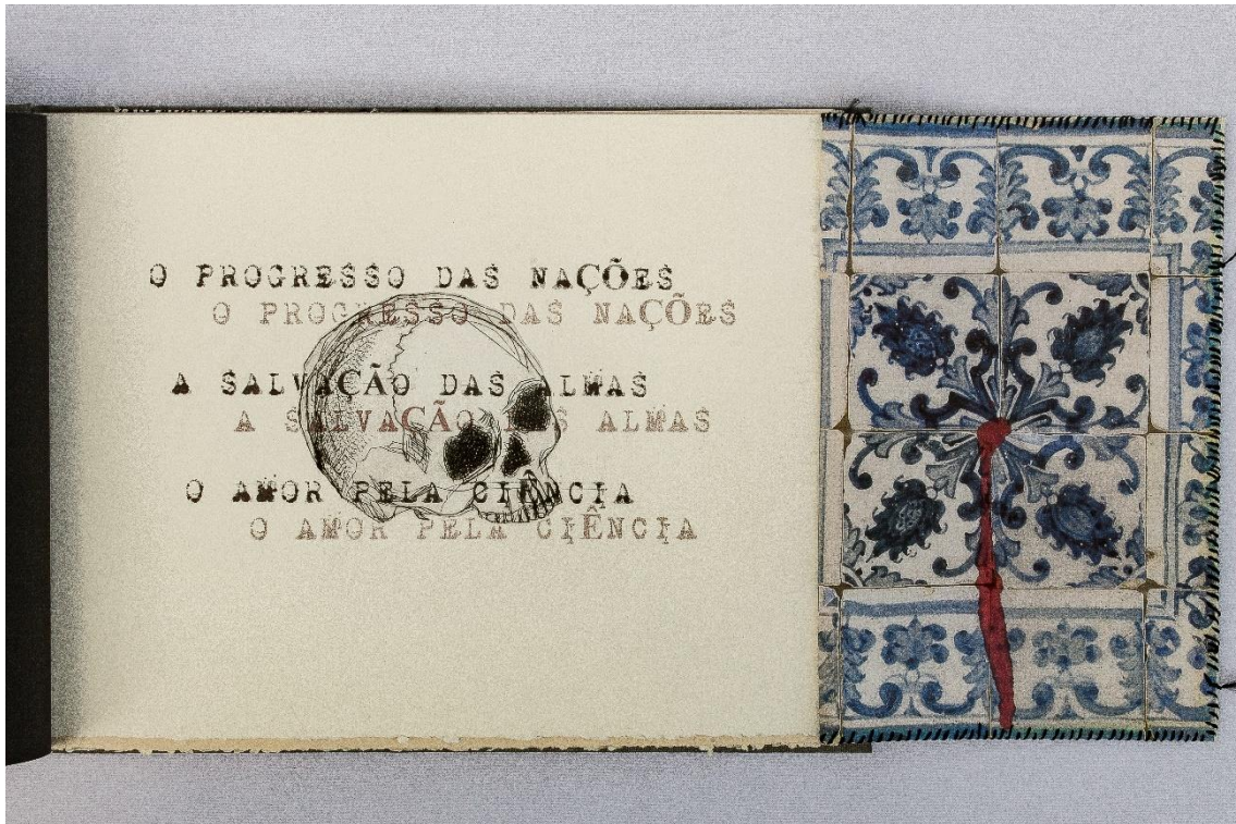
Rosana Paulino, ¿História natural? (2016), libro de artista.

las páginas siguientes, las consecuencias de su implementación. La colonización, representada por la imagen del azulejo chorreado con tinta roja que cubre parte de la tela, es una muestra de la inhumanidad y la violencia de este discurso.