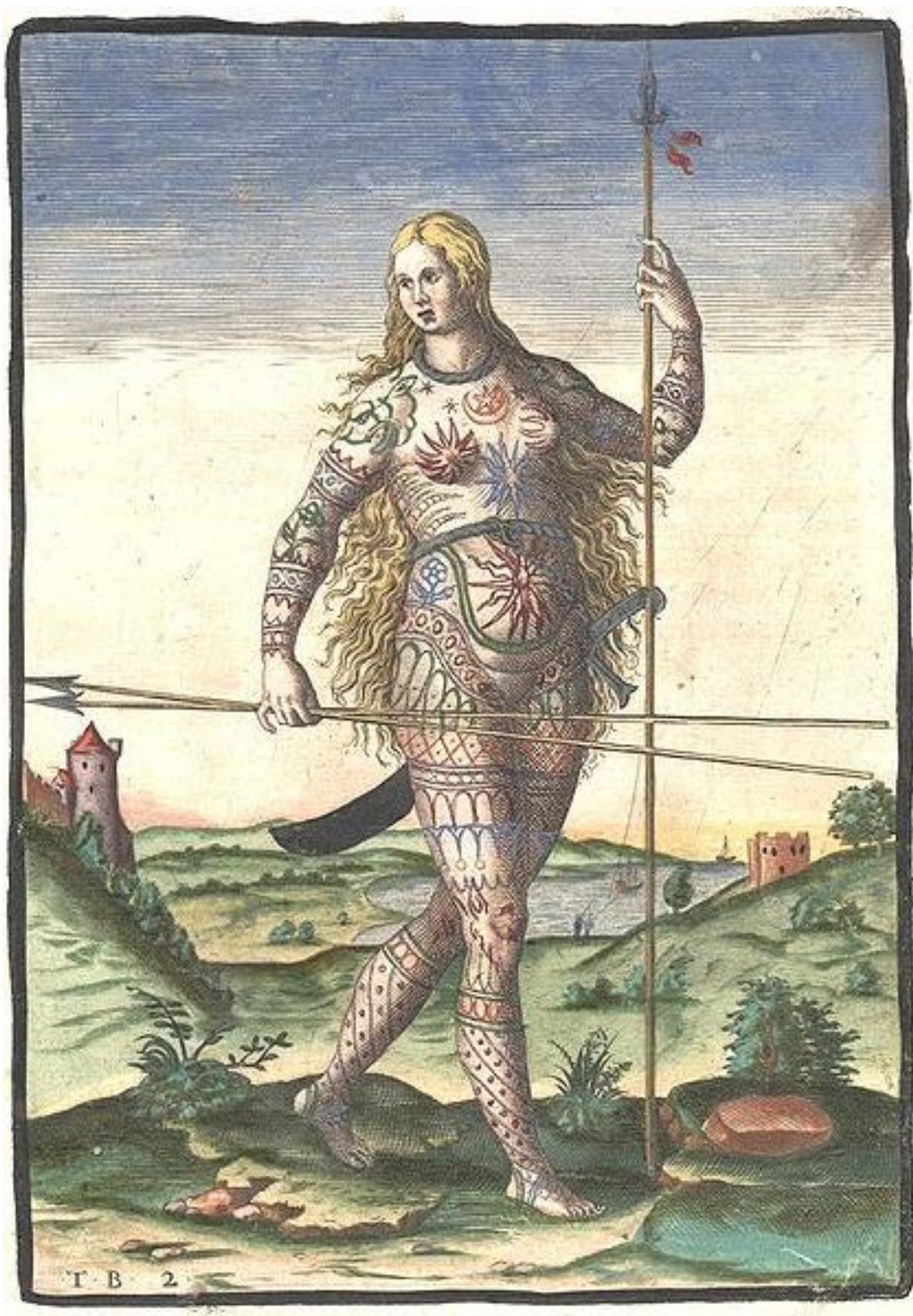
Theodor de Bry, Sin título (1590-1624), grabado.

En Figura de convite III , Varejão realiza una (re)apropiación y una subversión de la obra original. Por un lado, recupera la figura de entrada y lo hace a través de un grabado específico de Theodor de Bry que reproduce al óleo: es la figura de una “mujer desnuda, con pinturas en todo