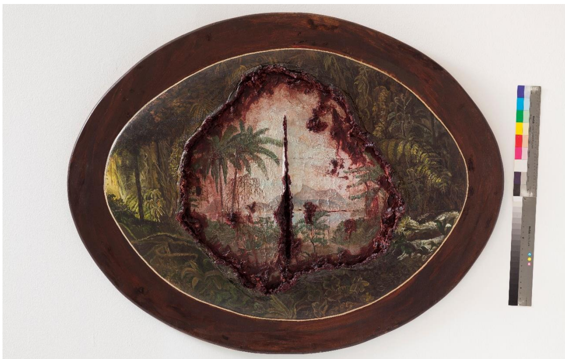
Adriana Varejão, Paisagens , série Terra incógnita (1995), óleo sobre tela.

En Paisagens , de 1995, la artista repone, en un marco de forma oval, dos tipos de paisajes en una misma obra. El primero, un paisaje exuberante, donde vemos vegetación de la selva brasileña. Este paisaje, que se ve en el borde exterior del cuadro, es una cita a la acuarela Forêt vierge du Brésil del Conde de Clarac (1777-1847) y es una de las imágenes de Brasil más divulgadas en el siglo XIX. El pintor y arqueólogo francés acompañó la misión diplomática a América del duque de Luxemburgo, permaneciendo en Brasil entre junio y septiembre de 1816. El artista representó aspectos del paisaje brasileño en óleos, acuarelas y dibujos, siendo muy conocida la obra antes mencionada, expuesta en el Salón de París de 1819. El segundo paisaje inserto en la pintura de Varejão, es el representado, ya con otras características, en el centro de la composición, similar a las acuarelas de artistas viajeros como Jean-Baptiste Debret o Johann Moritz Rugendas, tal como afirma Pedrosa (Andermann, 2018). Allí, en su centro, la pintura posee un corte en sentido vertical, un tajo, una forma de aludir a los propósitos extractivos del colonizador: la marca de la violencia. Así, la obra Paisagens muestra paisajes heridos a través de siglos de dominación, refiriéndose al expansionismo europeo y la consecuente explotación de la naturaleza para obtener conocimientos y recursos.