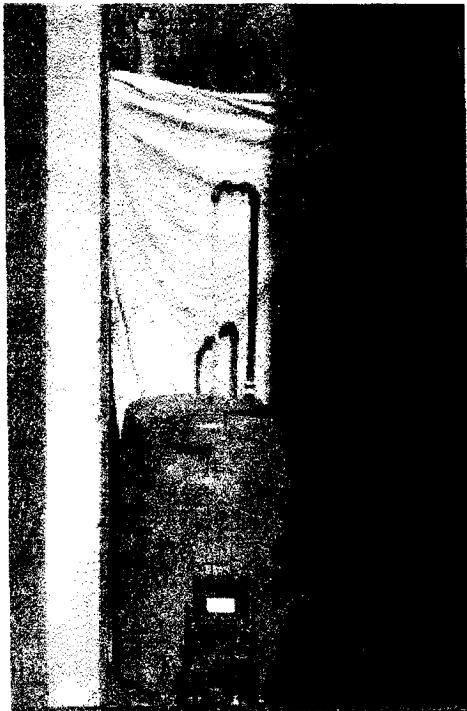
Fig.N°1: Prototipo funcionando.-