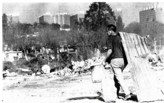
Figura 3. Fotografía del Parque Posadas