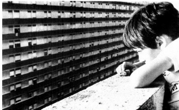
Figura 2. Fotografía del Parque Posadas por Fernando Giordano.

Fuente: SAU (1985). II Congreso Nacional de Arquitectos. La problemática de la vivienda en el Uruguay . Arquitectura. Revista de la Sociedad de Arquitectos del Uruguay , (253), 35-51.