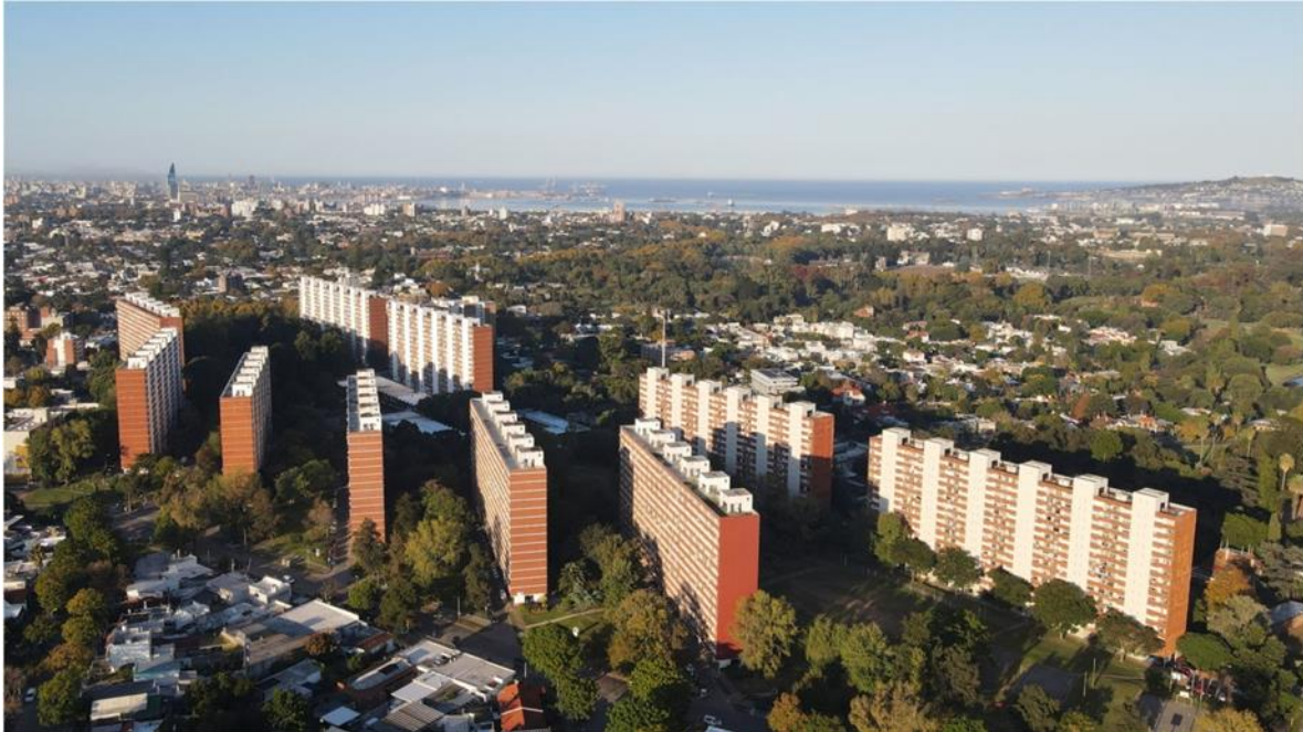
Figura 9. Vista aérea del Parque Posadas.