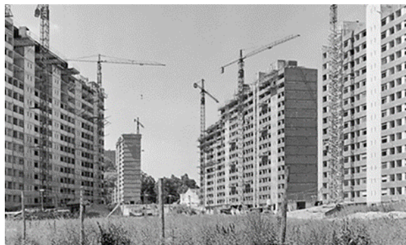
Figura 7. Fotografía del Parque Posadas en Construcción