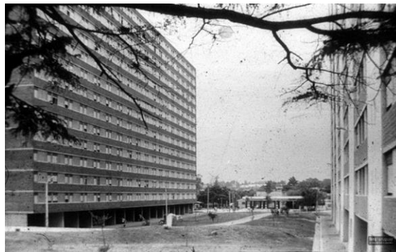
Figura 8. Fotografía del Parque Posadas en vísperas de su inauguración.