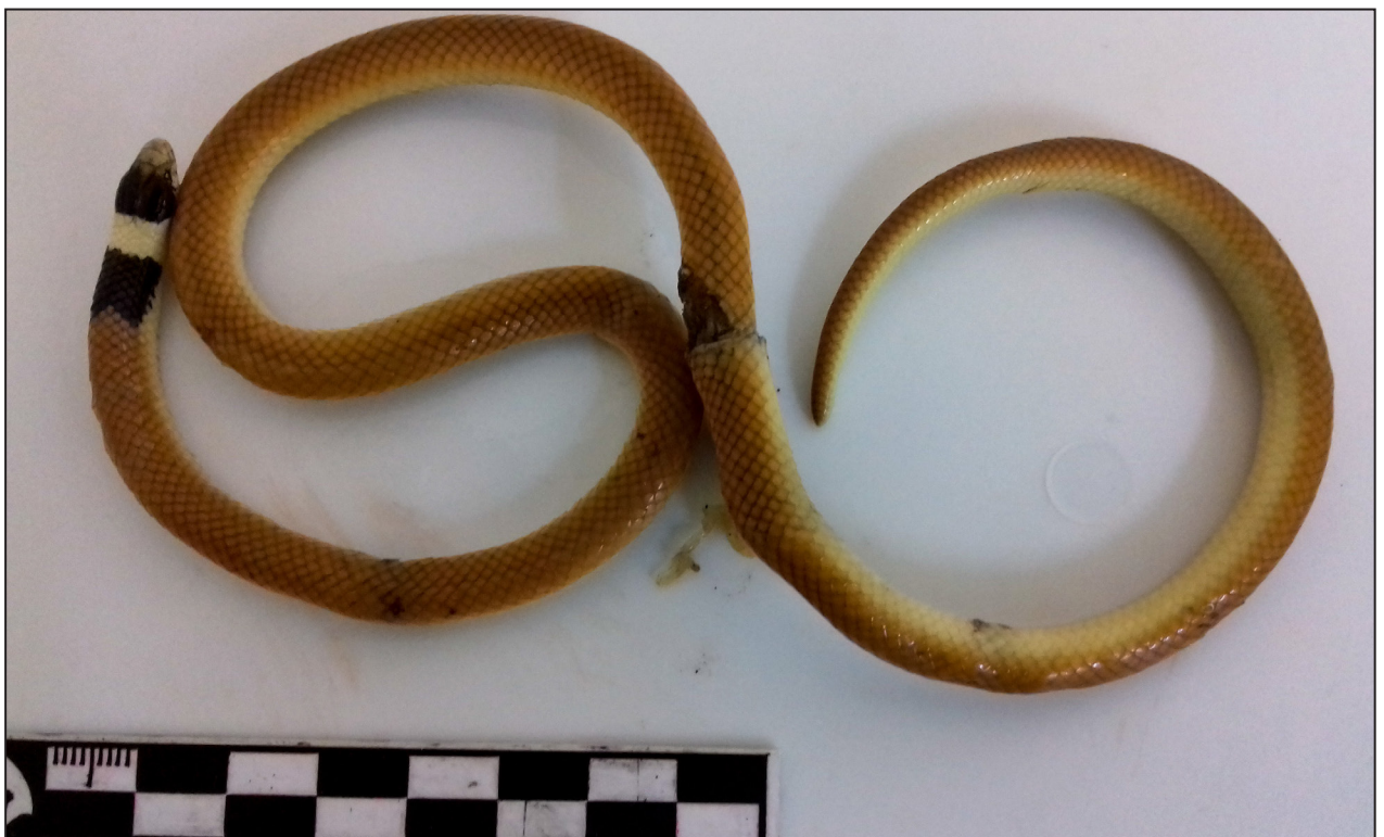
Figura 1. Phalotris cuyanus . Aimogasta, Departamento Arauco, La Rioja, Argentina. CRILAR-HP 18.

P. cuyanus es considerada una especie endémica de la provincia biogeográfica del Monte (Leynaud et al., 2005, Jansen y Kohler, 2008, Scrocchi y Giraud,