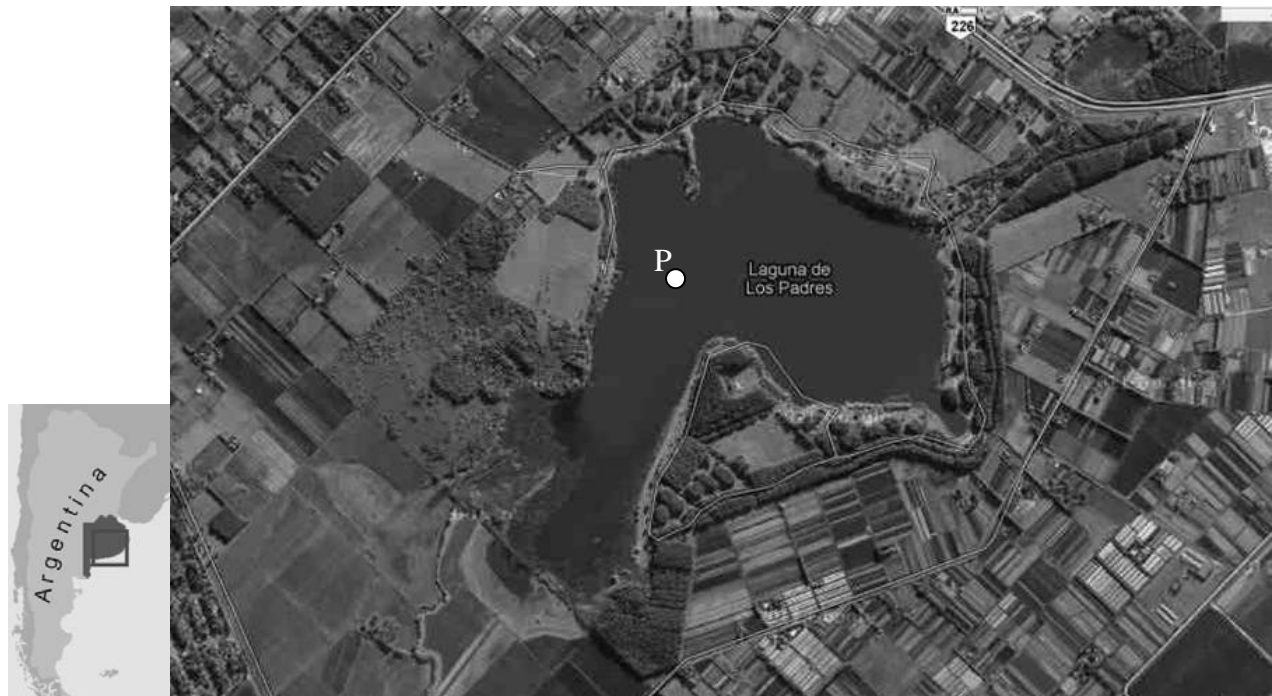
Figura 1: Ubicación de la laguna De los Padres y sitio de muestreo (P). En la imagen es posible observar que la laguna está rodeada de productores frutihortícolas.

Según el censo Hortícola y Florícola realizado en la Provincia de Buenos Aires (Ministerio de Economía, Provincia de Buenos Aires, 2006), las producciones intensivas en la zona, abarcan una superficie total de 4707 ha. La laguna De los Padres ( 37^{\circ} 55' 53,7'' \text{ S} ; 57^{\circ} 44' 11,9'' \text{ O} ), de 220 ha de superficie, queda incluida en este cordón (Figura 1). Como toda laguna pampeana, posee fluctuaciones de volumen influenciado por las precipitaciones regionales y la conexión con el acuífero.