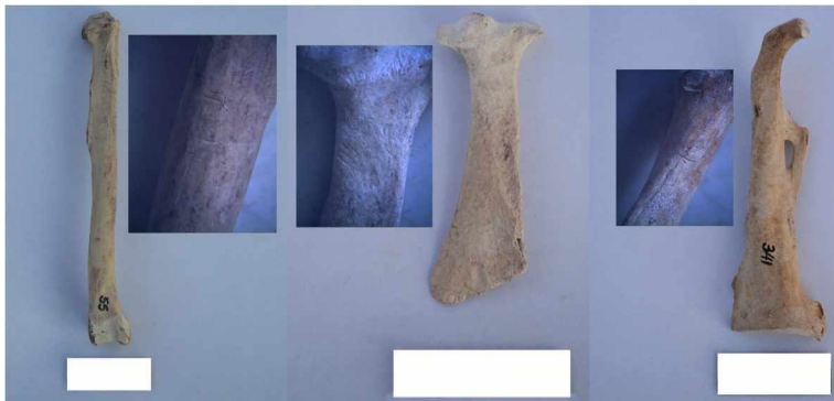
Figura 5. Marcas de corte antrópicas sobre escápula (arriba) y húmero (abajo, izquierda) de cormorán; y sobre coracoides de ostrero (abajo, derecha). La barra blanca equivale a 3 cm.