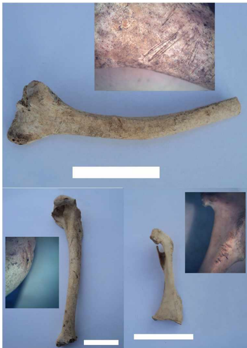
Figura 5. Marcas de corte antrópicas sobre escápula (arriba) y húmero (abajo, izquierda) de cormorán; y sobre coracoides de ostrero (abajo, derecha). La barra blanca equivale a 3 cm.