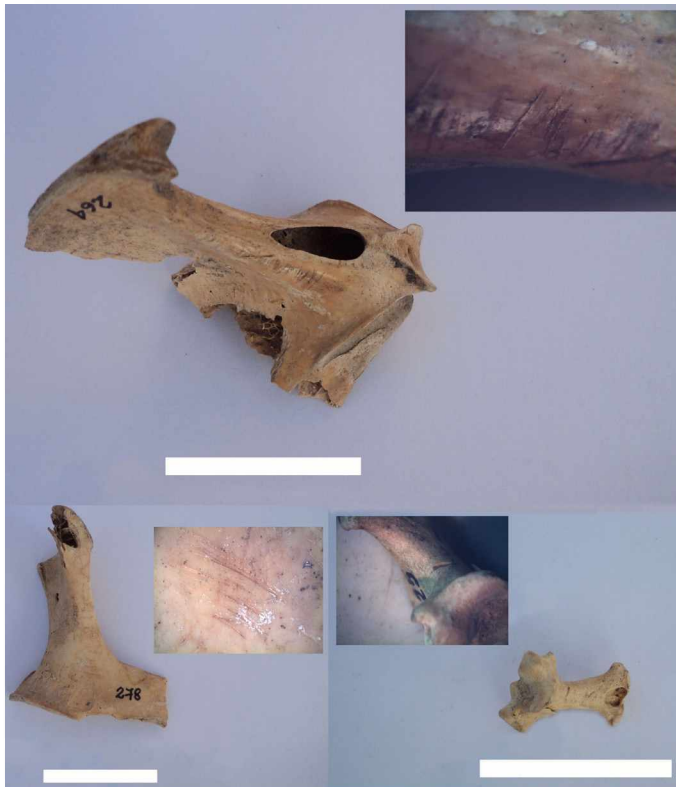
Figura 3. Marcas de corte antrópicas sobre huesos de albatros: Esternón (arriba), coracoides (abajo, izquierda) y cuadrado (abajo, derecha). La barra blanca equivale a 3 cm.

Las marcas de corte en V cortas, poco profundas y con disposición oblicua y/o perpendicular al eje del hueso, se ubican en la mayoría de los taxones sobre diáfisis y epífisis de húmero, ulna, carpometacarpo y fémur; diáfisis de tibiotarso y tarsometatarso; región proximal de la escápula y coracoides; porción media de la fúrcula; cresta del esternón; pelvis; y cuadrado (Figuras 3 y 5). En los elementos esqueléticos de pingüinos las marcas de corte aparecen de manera similar a las demás aves sobre húmero, escápula, coracoides, fúrcula, esternón, cintura pélvica, fémur y tibiotarso (Figura 4). Las marcas de corte largas, profundas y oblicuas al eje del hueso se encuentran sobre el cuerpo del esternón. Las fracturas antrópicas transversales y oblicuas al eje del hueso se presentan en la mayoría de los casos sobre la diáfisis de los distintos huesos largos que componen la anatomía ósea de un ave, con excepción de las falanges. Se hallaron tres fragmentos proximales de húmero de albatros, que presentan huellas de cercenamiento perimetral en el borde de la fractura ubicada en la región más distal de la porción proximal de la diáfisis (Figura 6).