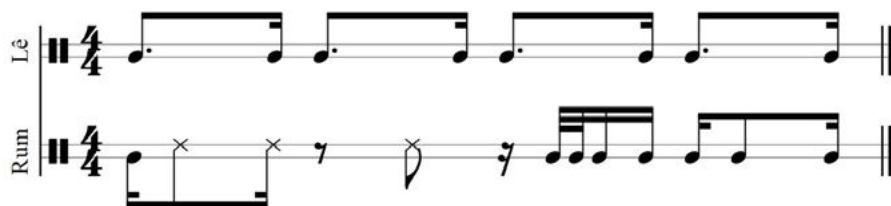
Figura 2: Patrones rítmicos del tambor Lê y del tambor Rum en «M'bala». Transcripción realizada por el autor.

Veamos qué pasa con las demás líneas: por un lado, tenemos los tambores tipo congas o atabaques —los tambores usados en las ceremonias de candomblé , conformados por un tambor agudo, uno medio y uno grave conocidos respectivamente como Lê , Rumpí y Rum —, donde podemos distinguir dos configuraciones. [Figura 2] Una genera el caminado de este tipo de sambas en el tambor agudo, atacando en la cuarta semicorchea seguido de un ataque a tierra coincidiendo con el pulso; y la otra en el tambor grave —que podría ser un tambor Rum —, coincidiendo con la clave en la primera parte del compás, ejecutando los ataques con slap , y en la segunda parte del compás con una frase ejecutada con sonidos abiertos: