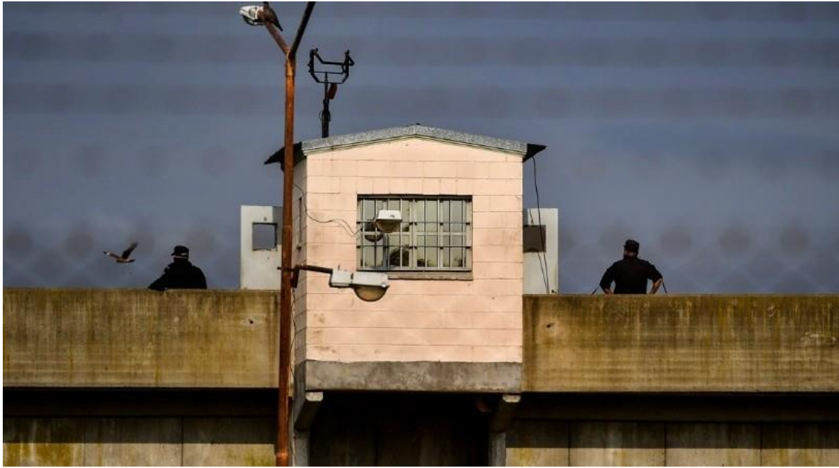
Otro motín: un preso murió en una cárcel de Florencio Varela