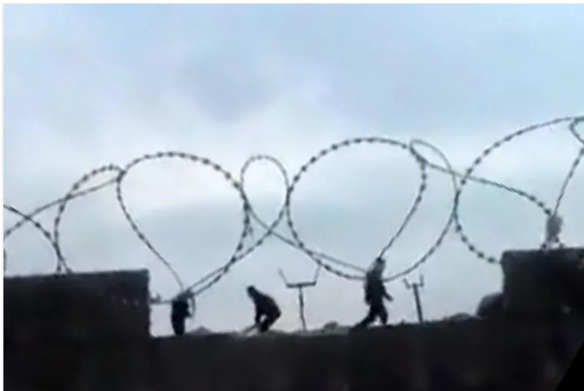
Un preso de la Unidad 23 de Florencio Varela fue asesinado captura video twitter @LeandroMoreno4