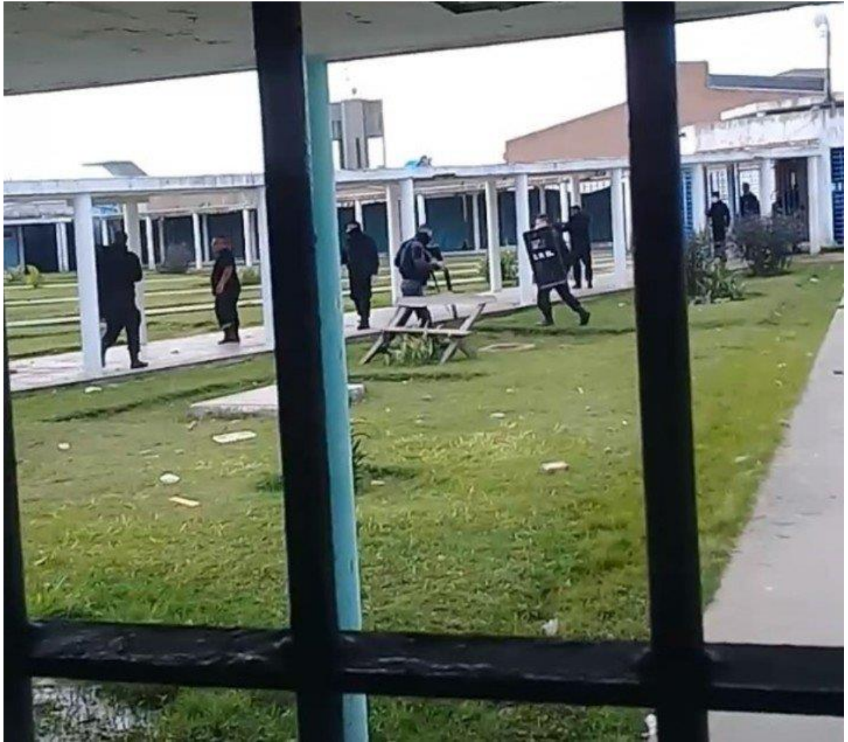
Un muerto tras graves incidentes en la Unidad 23 de Florencio Varela.