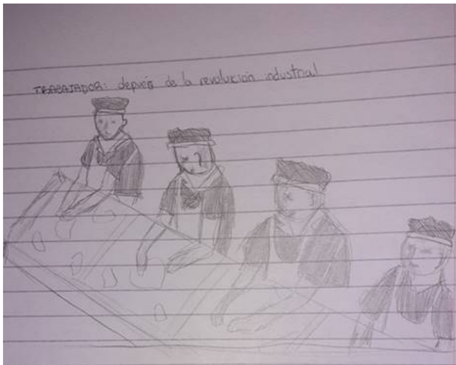
Figura 6. Estudiante 4, segundo dibujo