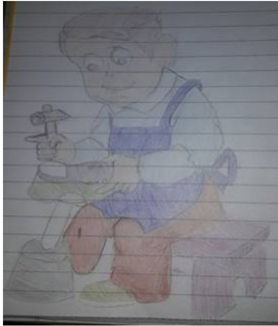
Figura 3. Estudiante 3, primer dibujo