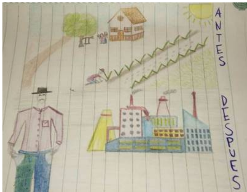
Figura 2. Estudiante 2