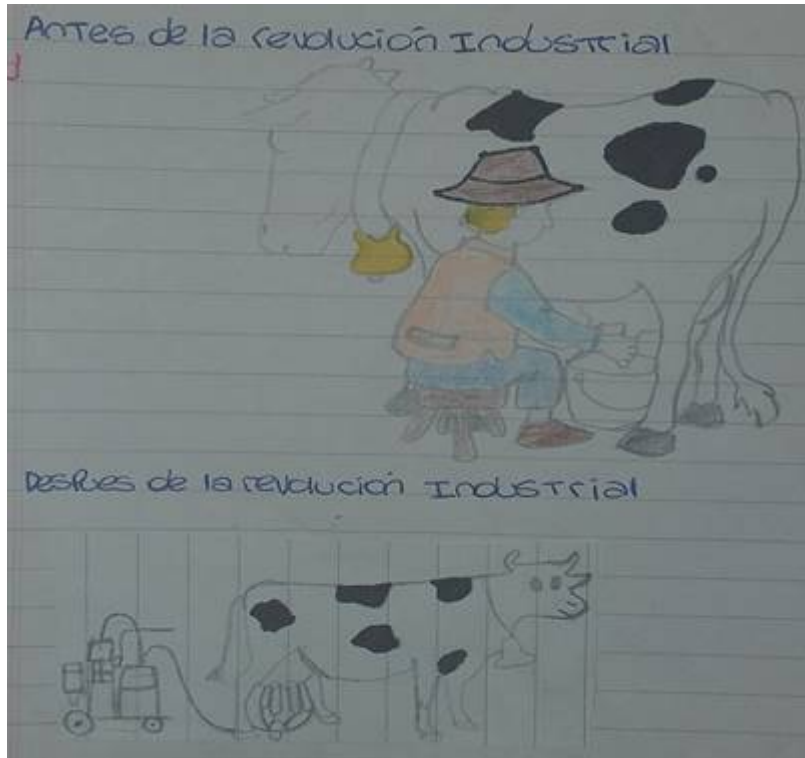
Figura 1. Estudiante 1