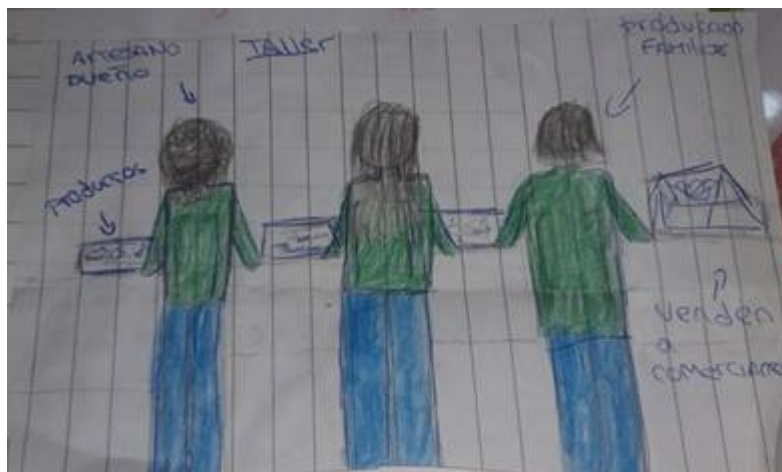
Figura 7. Estudiante 5, primer dibujo