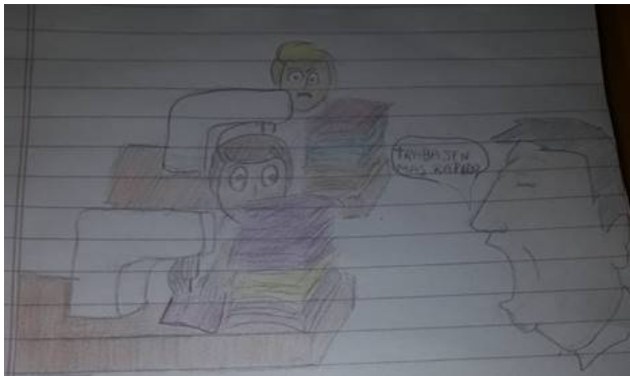
Figura 4. Estudiante 3, segundo dibujo