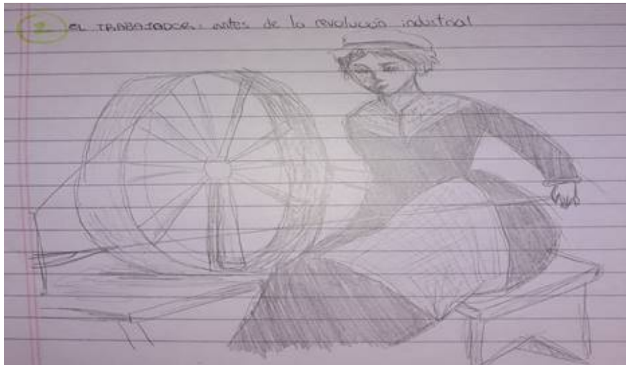
Figura 5. Estudiante 4, primer dibujo