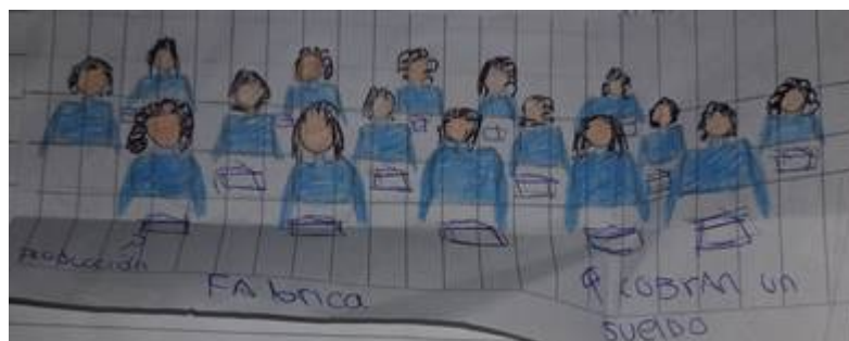
Figura 8. Estudiante 5, segundo dibujo

En los dibujos realizados se expresan algunos de los cambios que los y las trabajadoras vivieron en su vida diaria y laboral, con la instauración del capitalismo como sistema social, y el avance de la Revolución Industrial.