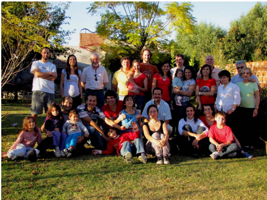
Grupo casi completo de integrantes del Laboratorio Ecofisiología Aplicada, UNLu, con apéndices (conyugues, novios/as, hijos/as)