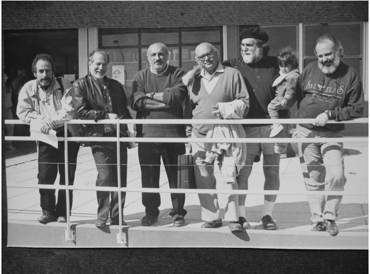
Congreso en Puerto Madryn, 1993