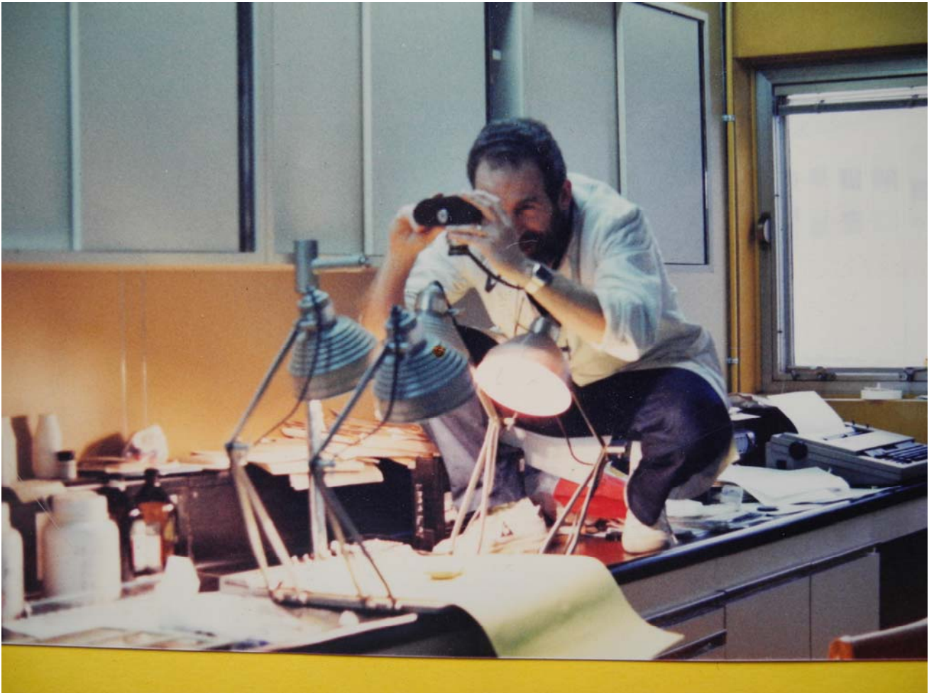
Fotografiando en su laboratorio. 1988