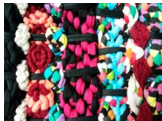
Antecedente: Producciones realizadas por los alumnos de 7° Año, de la materia optativa Taller Experimental de Producción Textil / Dictada por la prof, Analía Jara / Año 2014 / Plan no vigente.