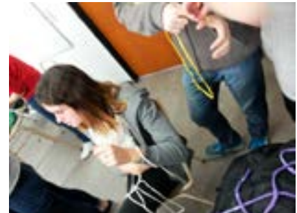
Experiencias textiles en el taller, tejido con los dedos, tejido con las manos. La Plata, junio del 2016.