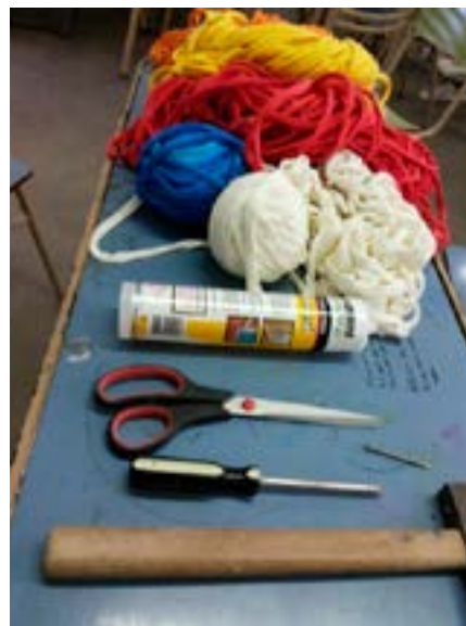
Esquicio en el taller, técnicas materiales aplicados. La Plata, agosto del 2016.