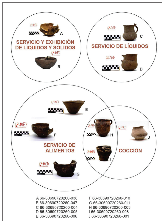
Figura 4. Colección arqueológica escuela San Agustín. Vasijas agrupadas según función estimada

Como el sitio se destaca por el arte rupestre, los docentes solicitaron la interpretación y significado de las pinturas, sobre todo de la denominada Cueva del Suri. En uno de los talleres relatamos sobre la investigación arqueológica de esta evidencia, los resultados obtenidos y las estrategias empleadas para su análisis, específicamente de las dificultades para efectuar una explicación literal del significado. La línea interpretativa de nuestro proyecto, tanto para el arte como para todas las evidencias, estuvo enfocada en explicar la funcionalidad del sitio, tanto de actividades rituales como domésticas (Bradley 2005; Brey 2012; Ledesma et al. 2019). También presentamos una síntesis de las evidencias rupestres en el Noroeste argentino y las clasificaciones de los temas y motivos rupestres (Aschero 2000).