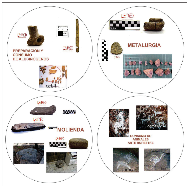
Figura 5. Talleres docentes: infografías sobre molienda, metalurgia, consumo de alucinógenos, preparación y consumo de alimentos

De esta manera, la evidencia sobre metalurgia y consumo de alucinógenos es parcial, pero son nuevas líneas para profundizar en el diseño de futuros trabajos (figura 5).