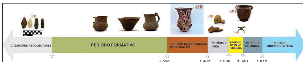
Figura 6. Infografía: línea de tiempo El Divisadero

Las secuencias y periodizaciones de la disciplina arqueológica y la empleada para el Noroeste argentino son diferentes a las líneas de tiempo empleadas por los docentes de educación primaria y secundaria en su representación gráfica. Así, realizamos una adaptación horizontal de la periodización e incluimos los Períodos Colonial e Independentista (figura 6).