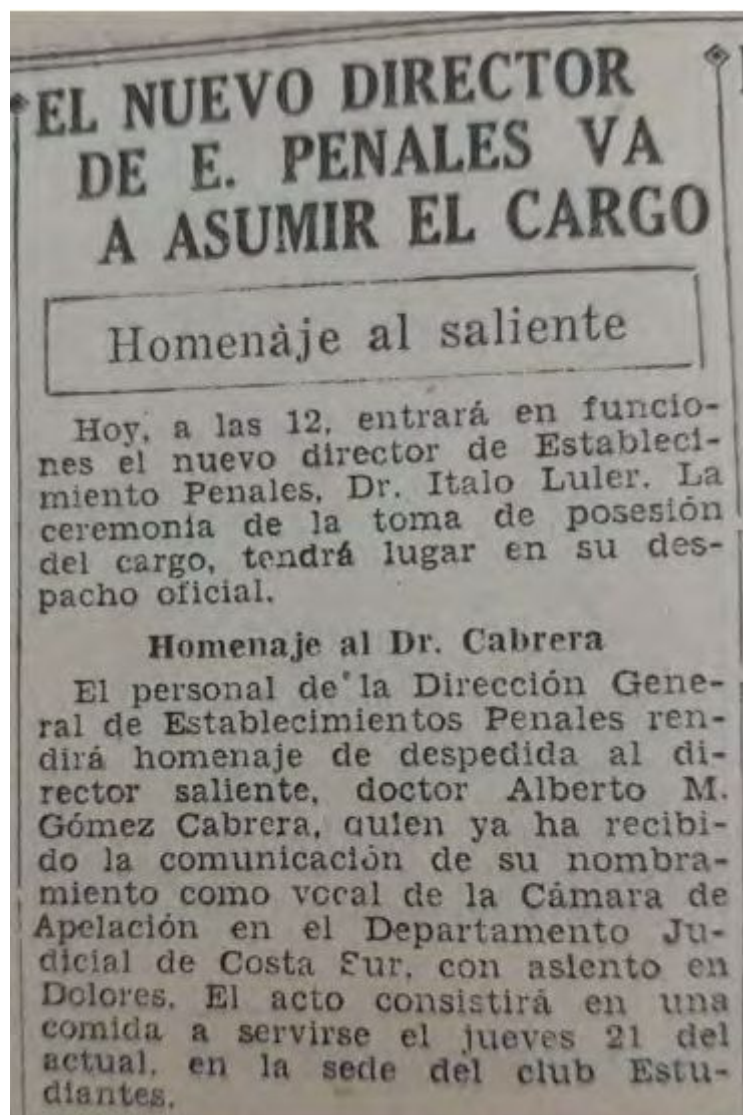
FIGURA 5: Nota sobre la asunción del nuevo Director de E Penales