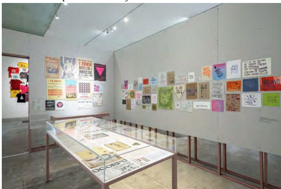
IMAGEN 6 Exposición Giro Gráfico: como el muro en la hiedra