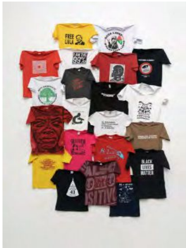
IMAGEN 4 Exposición Giro Gráfico: como el muro en la hiedra