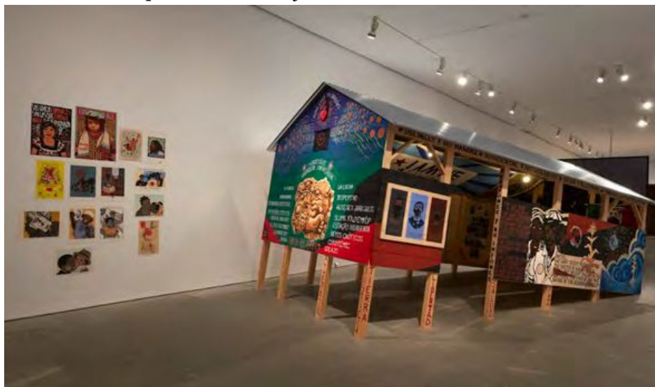
IMAGEN 2 Exposición Giro Gráfico: como el muro en la hiedra

campo del arte que tienen en común tanto la precariedad de los componentes y de los medios, como su potencial gráfico y de distribución. La exposición entiende la noción de gráfica en un sentido expandido y la idea de giro como revuelta, desafío al poder e inversión de lo dado. Como en el muro la hiedra hace referencia a un verso de la canción Volver a los diecisiete de la cantautora chilena Violeta Parra.