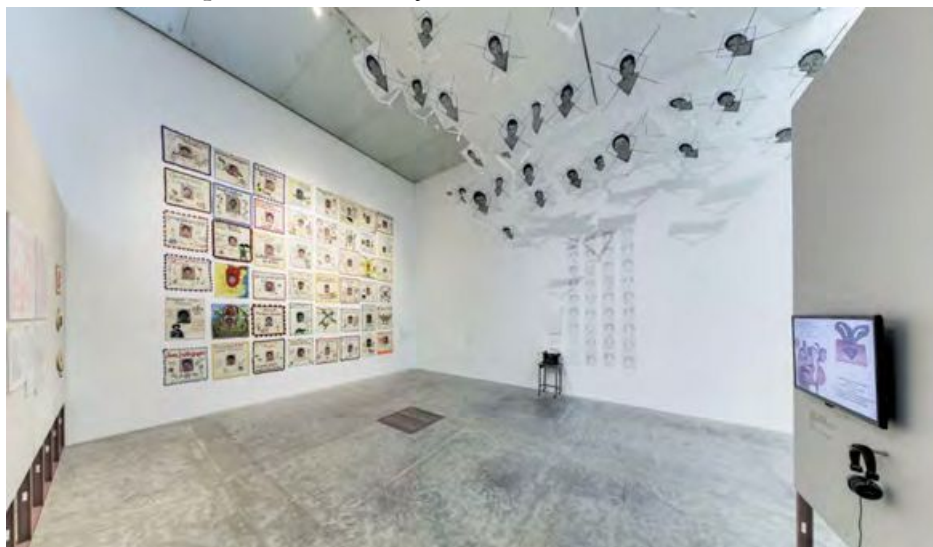
IMAGEN 5 Exposición Giro Gráfico: como el muro en la hiedra