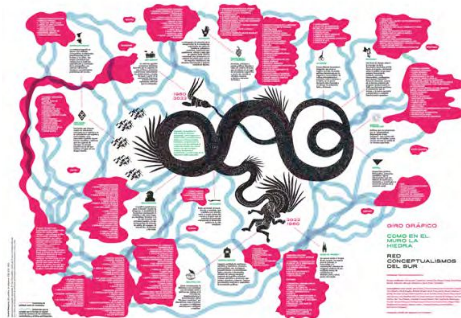
IMAGEN 7 Exposición Giro Gráfico: como el muro en la hiedra