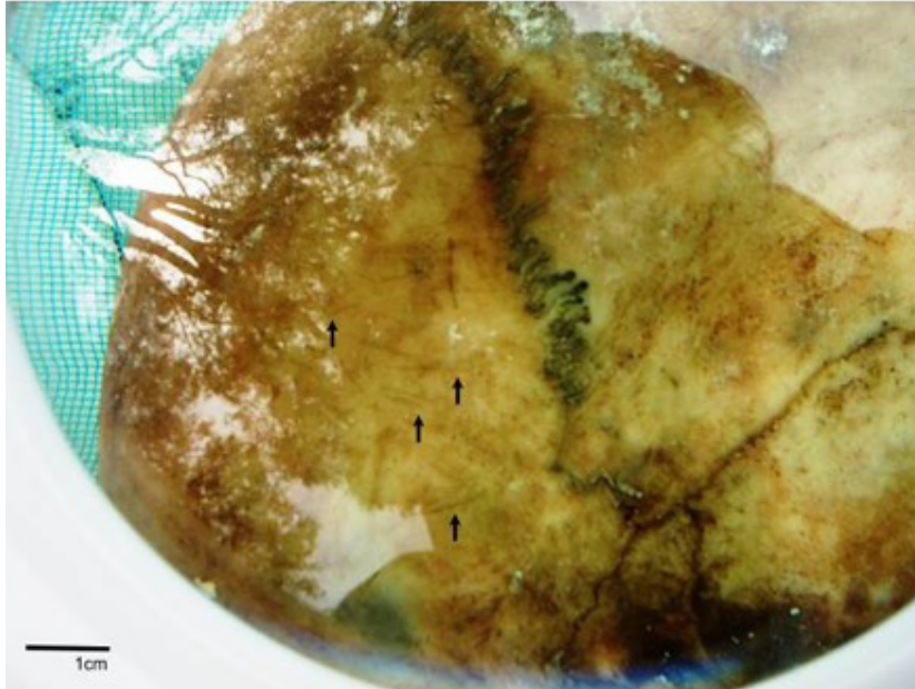
Figura 7. Cráneo y detalle de marcas de corte