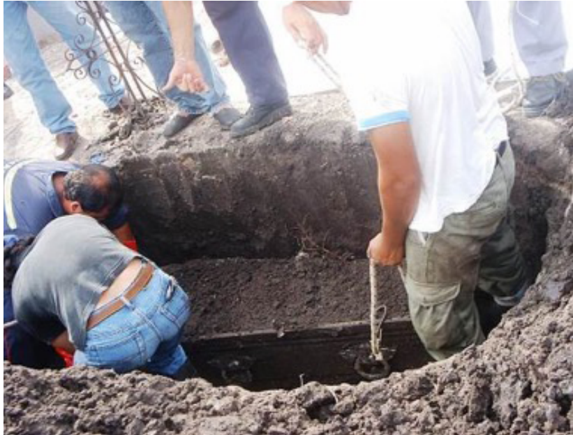
Figura 3. Exhumación del cuerpo