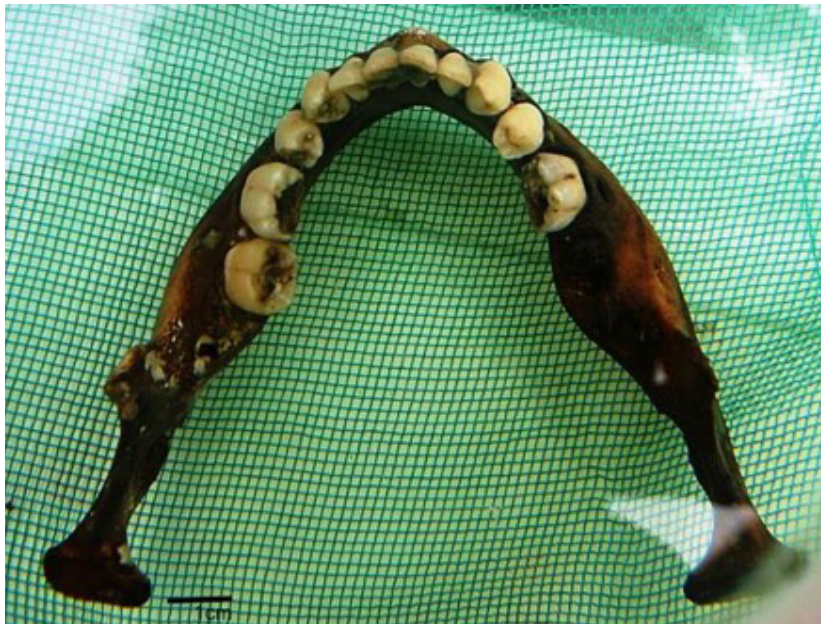
Figura 8. Mandíbula