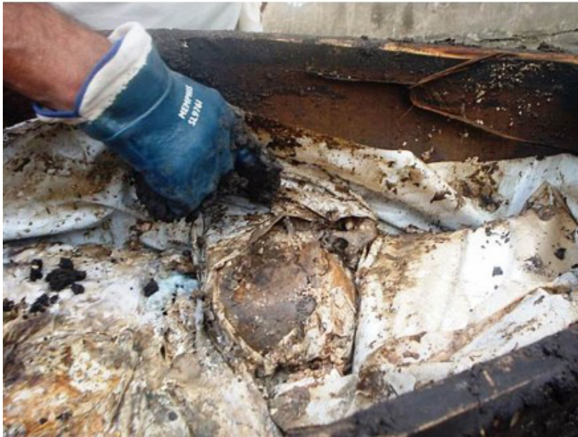
Figura 5. Cubierta de nailon sobre el cuerpo

Luego de un cuidadoso inventario, se procedió in situ a aislar y extraer piezas óseas diagnósticas las cuales fueron acondicionadas para ser descritas sucintamente a partir de observación macroscópica, con lupa de luz fría (Dolomit), y registradas fotográficamente. Las más significativas para los requerimientos judiciales incorporados a la causa se documentaron listándolas en orden numérico (Figura 6):