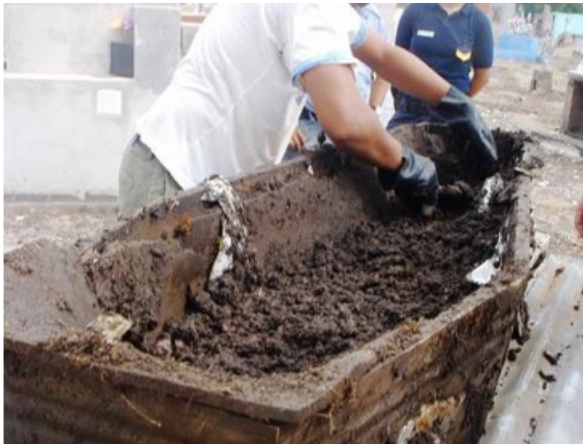
Figura 4. Retiro del excedente de tierra

El trabajo bioarqueológico consistió en registrar, localizar, identificar e inventariar las piezas disponibles verificando sus características generales y su disposición. La presencia de un cobertor de nailon colocado entre el piso del ataúd