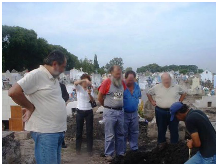
Figura 2. Tareas de excavación en el cementerio

a aparecer el borde del ataúd. Ya delimitado en su totalidad el espacio ocupado por el féretro, se consideró indispensable ampliar la superficie de excavación hacia los lados de manera que se facilitara su extracción. Se continuó descendiendo por los laterales, sin hurgar la zona de tapa dado su deficiente estado de preservación (Figura 3), y excavando la periferia con el objetivo de pasar por debajo del ataúd algún elemento rígido que permitiera su extracción de la manera más completa posible. El estado de conservación general era regular y el agua representaba el principal agente agresivo. Se logró despegar el féretro de su posición original realizando presiones desde distintos puntos, y fue sacado de la fosa colocándolo encima de una tabla de madera ubicada sobre un móvil de desplazamiento de ataúdes de uso común en el cementerio. En este momento se consideró necesario aliviar el peso retirando la tierra que aún quedaba depositada por encima de la tapa (Figura 4). Revisados exhaustivamente todos los sedimentos removidos durante la exhumación, se rotularon y embolsaron aquellos elementos necesarios para un eventual análisis posterior. Se trasladó el féretro en un vehículo policial hasta la morgue del hospital local Las Mercedes, lugar donde el equipo procedería e extraer los restos del ataúd para su análisis.