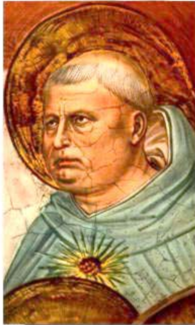
Foto N° 295 : Pintura que representa a Santo Tomás de Aquino (1225 – 1274), uno de los más grandes teólogos de la Cristiandad .-

Uno de los más grandes pensadores y teólogos de su época, Santo Tomás de Aquino (1225–1274) escribía en su “ Summa Teológica ” lo siguiente respecto al tema del que estamos hablando : “El fin de la profecía es mostrar con claridad una verdad que excede la capacidad natural del hombre. Aquella, en que la verdad sobrenatural se muestra en una visión intelectual es más excelente que aquella otra en la que esa verdad se muestra por medio de imágenes. Pero aunque en sí sea “más excelente”, puede ser también más difícil de comunicar a los demás hombres .Las imágenes siempre son claras, dinámicas, comprensibles. Pero las palabras, por el contrario, han de ser sometidas a un proceso lento y difícil que solamente las haría comprensibles para aquellas personas que están de antemano preparadas e interesadas por el tema. Los profetas no siempre comprenden lo que están diciendo; no es siempre fácil determinar qué par