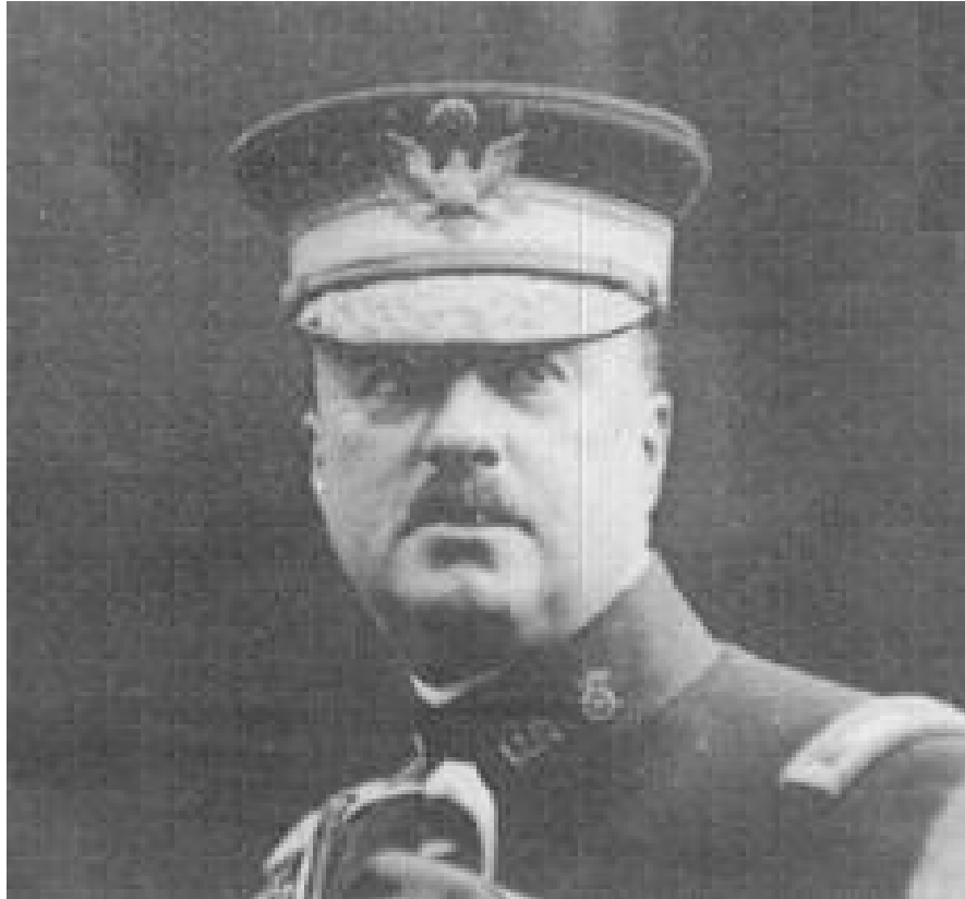
Foto N° 301 : Fotografía del Mayor Archibald Butt, quién ,desde días antes , se comenzó a sentir deprimido, por motivos aparentemente inexplicables. Pero ,también aparentemente, Butt ya preveía lo que pasaría durante el viaje del “Titanic” hacia América : su propia muerte . . . .

Otro caso de evidente premonición fue el que se produjo con el Mayor Archibald Butt .Butt era el edecán militar del Presidente Taft (U.S.A.) y