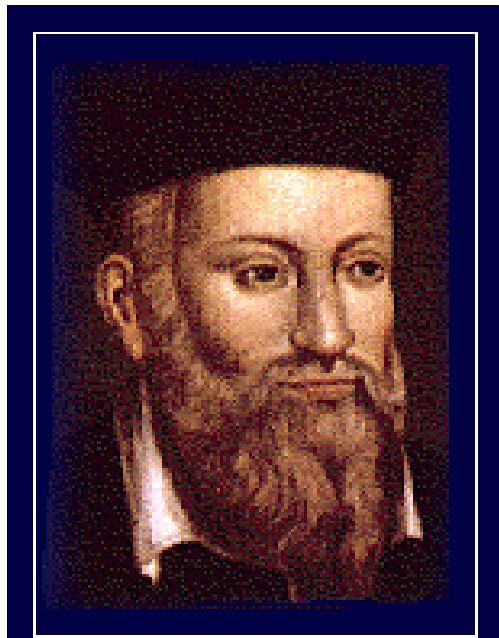
Foto N° 296 : Grabado de Miguel de Nostradamus (1503-1566) ,quién fuera el autor de las célebres “cuartetas”, varios tomos de predicciones , algunas cumplidas y las otras . . . .el tiempo lo dirá .-

Y han habido muchas personas que han corrido el “velo” de ciertos acontecimientos , a lo largo de la Historia de la Humanidad. Entre ellos, uno de los más destacados es el francés Miguel de Nostradamus (1503-1566) . La mayoría de los mencionados sucesos se han cumplido, hasta ahora.