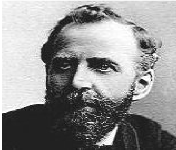
Foto N° 303 : Fotografía del escritor y periodista norteamericano William Stead , que , proféticamente , redactó un artículo sobre un buque de línea que se hundía en el Atlántico Norte , el cual tenía falta de botes salvavidas . Este artículo se escribió 26 años antes del hundimiento del RMS “Titanic”. Quizás por ello Stead estaba triste : había pronosticado su propia muerte . . . .

De todos modos, para terminar con este panorama sobre lo que fueron los diferentes avisos de la ocurrencia de una tragedia marítima en aguas del Océano Atlántico, y habiendo hablado del periodista William Stead , digamos también que escribió, en el año 1886 ( veintiséis años antes ) un cuento similar a la novela de Robertson y que llevaba por nombre : “How the Mail Steamer went down in the Mid Atlantic, by a survivor” , que en español se podría traducir por : “Cómo se fue a pique el Vapor de Correo en el Atlántico Medio, por un sobreviviente” . En esta historia, Stead habla sobre un gran vapor que se hunde, luego de chocar contra otro barco. Stead (refiriéndose al hecho que narra en este escrito, de la gran pérdida de vidas debido a no contar el barco con suficientes botes de salvamento) dice : “Esto es exactamente lo que podría tener lugar y lo que tendrá lugar , si los buques son enviados al mar faltos de botes salvavidas”