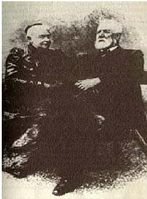
Foto N° 297 : Fotografía de Julio Verne y su señora esposa, en los últimos años de su vida .Gran escritor y visionario de los progresos de la Humanidad en lo concerniente al futuro, dejó libros proféticos : “Viaje de la Tierra a la Luna”, “Viaje al Centro de la Tierra”, etc.-