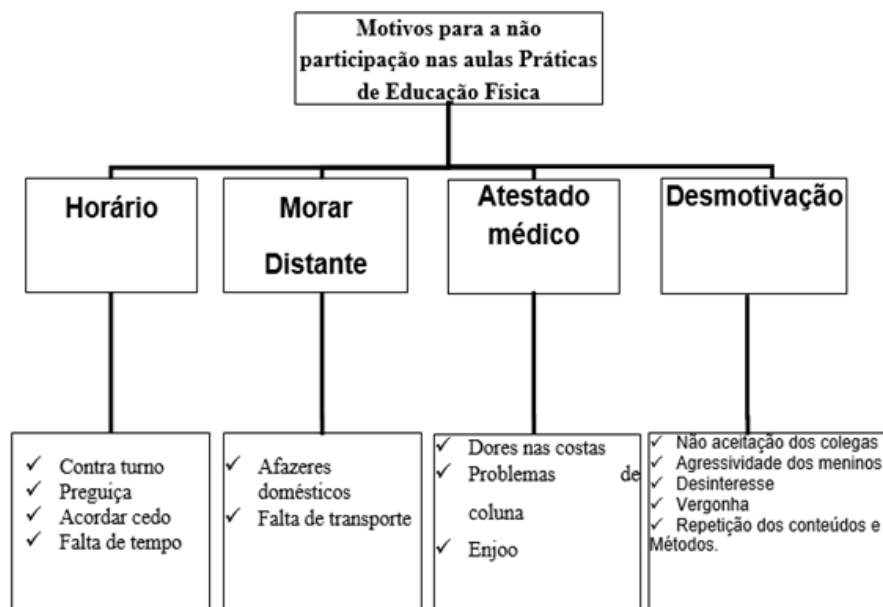
FIGURA 1 Exposição dos motivos para a não participação nas aulas de Educação Física

Essa categoria tem como objetivo identificar os motivos para a não participação das estudantes nas aulas práticas de Educação Física. Assim sendo, foram encontrados os seguintes eixos categóricos: horário, morar distante, atestado médico e desmotivação. Como apresentados no diagrama a seguir: