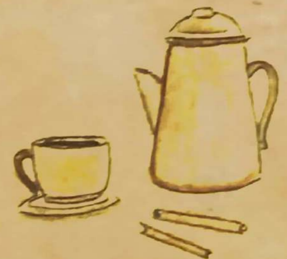
Ilustración Sol Cousillas