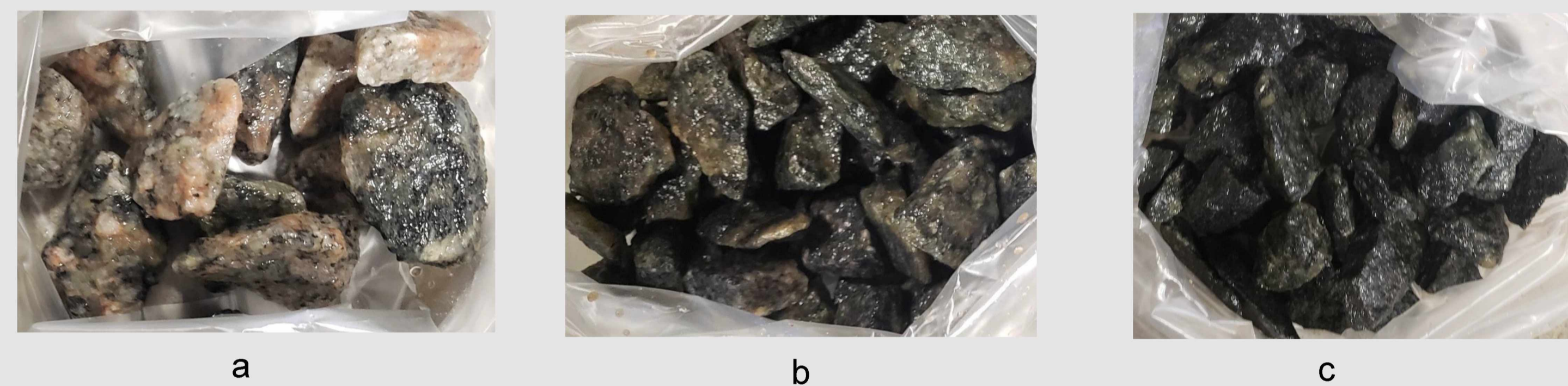
Fig. 2 - Variaciones litológicas identificadas en la fracción de agregados retenidos en el tamiz 1/2": a- Granito rosado, b- Granito gris, c- Facies micácea.

Estas conclusiones preliminares deberán complementarse con una mayor cantidad de datos y estudios petrográficos de detalle, para poder establecer relaciones que vinculen la morfología de los agregados con sus características petrográficas en forma más precisa.