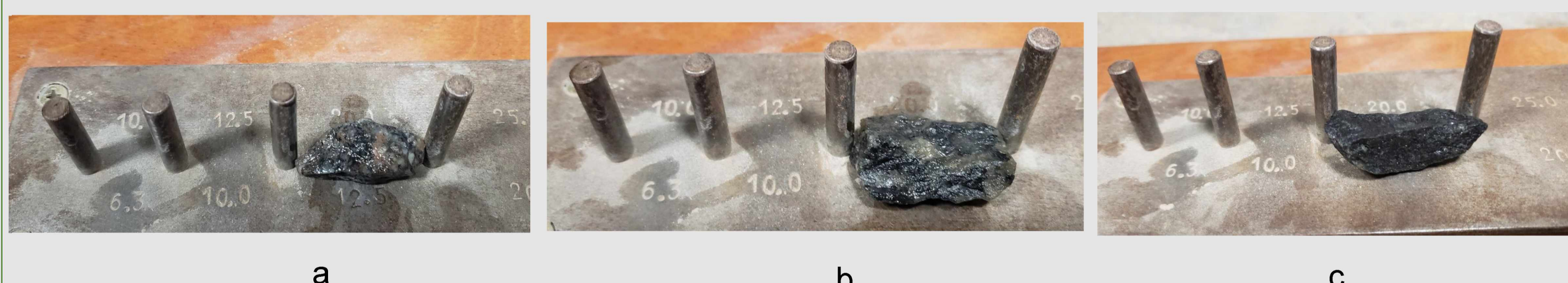
Fig. 4 - Evaluación de partículas lajosos para cada grupo litológico: a- Granito rosado, b- Granito gris, c- Facies micácea.