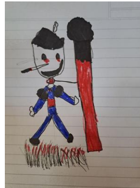
Dibujos de estudiantes de 2°, 2022