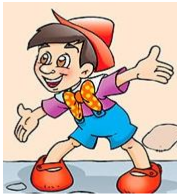
Las aventuras de Pinocho (1940) adaptada por Disney

Por último, gran parte de los niños se aferró a la historia de los cuentos maravillosos, eligiendo al Pinocho “dulce y bonito”, con todos los elementos mágicos y finales felices conocidos, sin dar lugar a nuevas versiones.