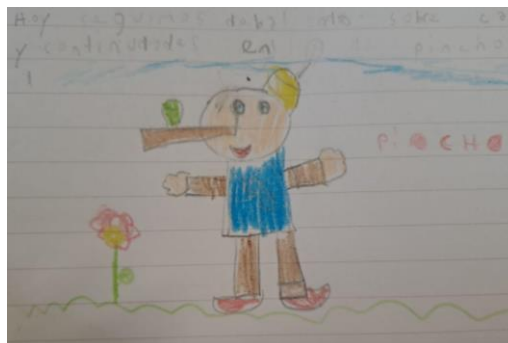
Cuento (2022). Leído en el aula