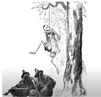
Imagen del cuento original 1883