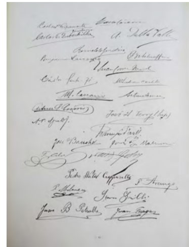
Figura 1 a, b, c. Sociedad Estímulo de Bellas Artes, "Asamblea extraordinaria celebrada el 31 de enero de 1900 en el local de la Sociedad" en Academia Nacional de Bellas Artes y Escuela de Artes Decorativas e Industriales 1878-1928, 1927 , pp.11-13)