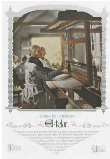
Figura 3. Industrias primitivas. El telar (1926). Plus Ultra, (134), p. 51.

Una nota en Caras y caretas de 1917 hace una reseña de los trabajos en un taller-fábrica textil tradicional —no se menciona su nombre— organizado por Onelli. El texto destacaba la presencia de mujeres santiagueñas en Buenos Aires, llevadas especialmente para la tarea del hilado y el tejido de tapices; junto a ellas había arribado el mate, la coca y el quechua que se asentaban no en la Boca —zona de exóticos idiomas— sino en plena Avenida Alvear. En las imágenes se las ve hilando el vellón a la manera tradicional y se explicaba que se hacía uso solo de tinturas naturales que se hervían en calderos al exterior. La descripción de otra instantánea de la misma nota recuperaba el «chirrido característico de las ruecas como en el famoso cuadro de Velázquez» [Figura 4], referencia con la que el autor de la nota de algún modo buscaba dar prestigio al lugar de las hilanderas. En la fotografía se ve solo un hombre presente, un obrero de la Real Fábrica de Tapices de Madrid que «dirige y enseña a unos treinta alumnos que ya lo secundan hábilmente» (Ruspi, 1917, p. 40). La propuesta de Onelli combinaba distintas tradiciones: el conocimiento del trabajo en el telar tradicional que traían las mujeres santiagueñas —aquel que, consideraba, venía del mundo prehispánico—, puesto en pie de igualdad con el tapiz europeo y a la vez enriquecido a partir de la participación de especialistas del viejo continente.