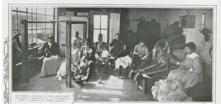
Figura 4. Sebastián Ruspi. Una vieja industria nacional 'torniamo all'antico' (1ro de septiembre de 1917). Caras y Caretas (987), pp. 40-41.

7 Desconocemos en qué establecimiento fueron realizadas las obras. En este sentido, no deja de resultar curioso el hecho de que la bibliografía consigne que la fábrica de Tucumán se creó en 1919: de ser así, las obras del primer salón provendrían de otro lugar.