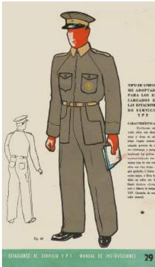
El indumento en el manual original de YPF.

“Uniforme color verde oliva con charreteras y vivos en color beige (según muestra), estando provisto de cierre relámpago y mangas ragland. La gorra va confeccionada con el mismo tipo de tela verde oliva con vivo beige, según grabado y visera de cuero negro, y lleva bordada en color oro brillante dentro círculo azul y blanco la insignia YPF. Cinturón de cuero color natural” (1942:29).