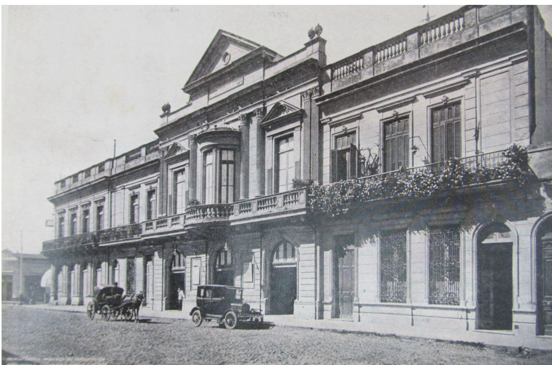
Imagen 1. Teatro Municipal Coliseo Podestá en el año 1930