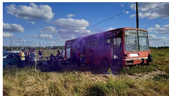
Figura 3. Revelado de antotipo con cúrcuma en Micromorada en red. Figura 4. Inauguración Micromorada.

Al finalizar la jornada se realizó un evento musical a cargo de la banda de Rap "Siberian Crew" uno de sus integrantes Pol Zuco compositor y vecino, incorporó en sus canciones los nombres de las calles y otras alusiones al Barrio Arco Iris.