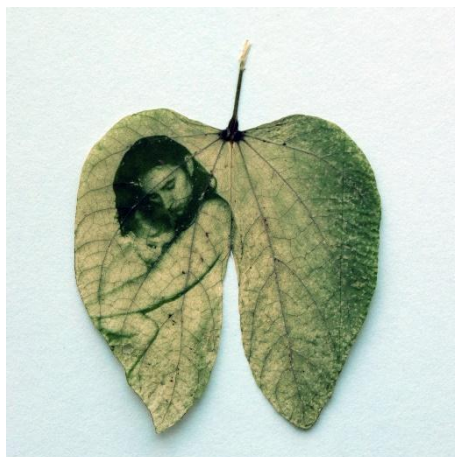
Figura 2. Alimento de Yanina Hualde. Clorotipo en hoja de Pasuña de Vaca 2018.

En segundo lugar el clorotipo , Este proceso de este tipo de copiadados es por contacto, con la superposición de una positivo impreso en un papel film sobre una hoja vegetal y sostenido por un vidrio por arriba de estas dos y una madera a modo de tabla que contiene el preparado. Todo esto entre broches para evitar el movimiento, luego se expone al sol hasta que la clorofila empieza a liberar su color verde y comienza un proceso de despigmentación de la hoja, Este proceso solo sucede en las partes que están expuestas al sol, mientras que las que están por debajo de la imagen en filmina conservan su color. Produciendo así la imagen revelada sobre el vegetal.