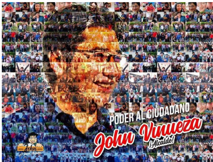
Foto de portada de Facebook, 16/03/2019

Este encuadre motivacional se construye también en conjunto con un encuadre diagnóstico para distinguirse de quiénes eran y qué hacían los políticos: