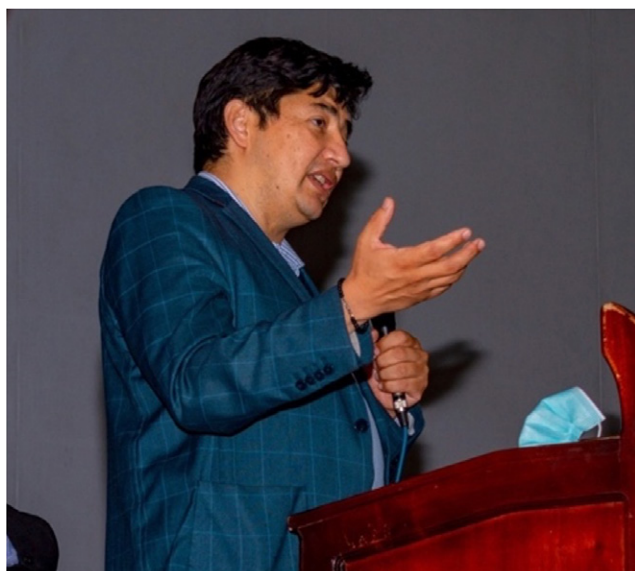
Imagen de perfil, 16/03/2022