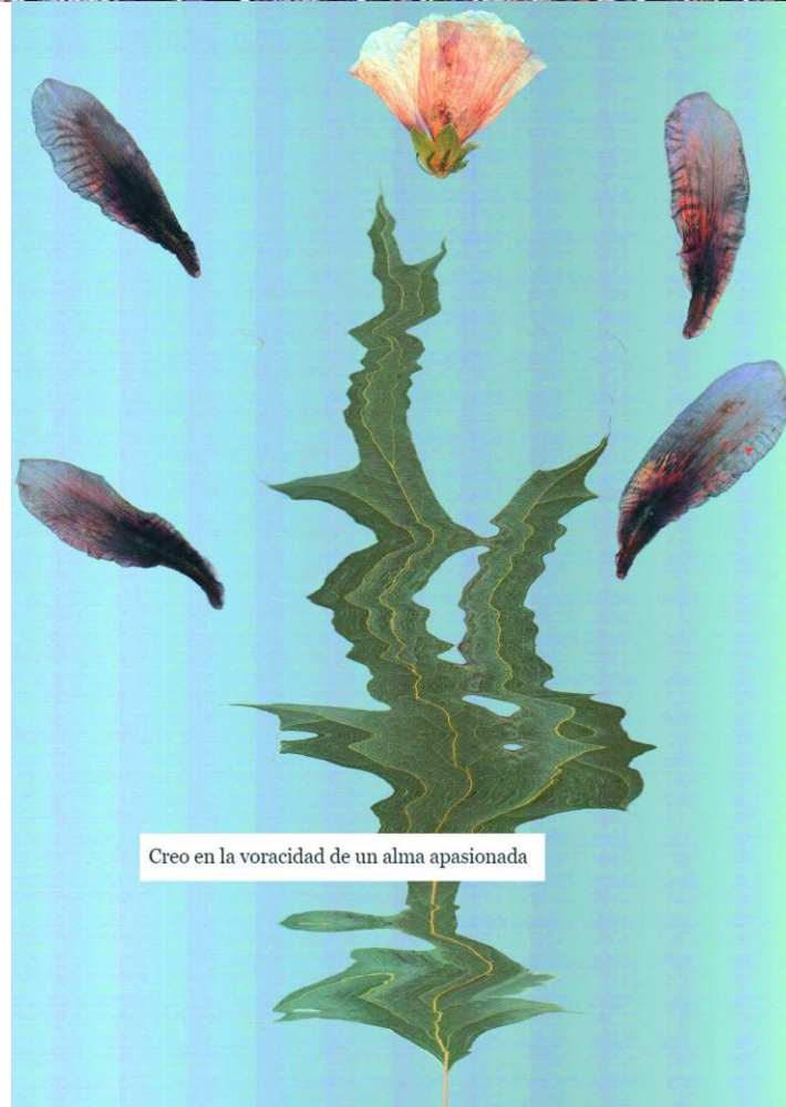
Figura 3. Estefanía Ferrari (2022). ¿Qué se sentirá tener tanta certeza en la vida? Escanografía botánica. Página 12 del fanzine digital. Recuperado de: https://issuu.com/estefaniaferrari/docs/tapa_img7_1_merged

Por otro lado, en las fotografías donde predomina la construcción espacial de la composición [Figura 4] se trabajó a tapa abierta manteniendo oscuro el cuarto de trabajo. La iluminación sectorizada y los múltiples planos de enfoque capturan los volúmenes con un efecto estético característico del escáner que es logrado por el tiempo de exposición propio de los fotosensores lineales.