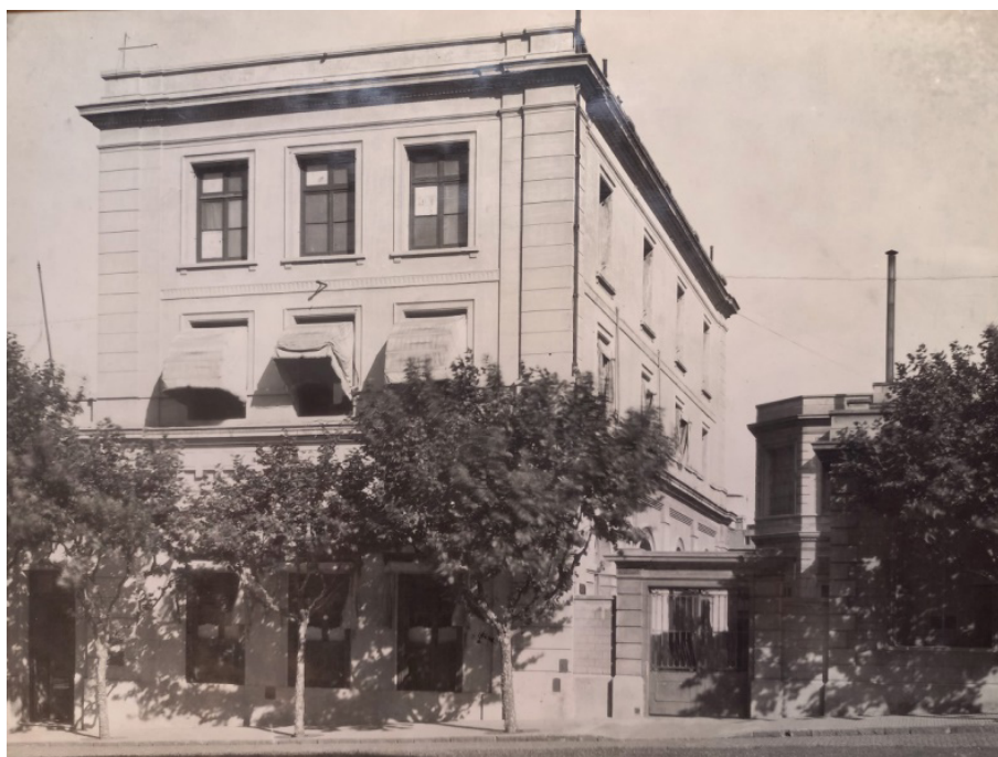
Figura 1. Sede del Museo. Dirección General de Minas, Geología e Hidrología. Maipú 1241, Ciudad de Buenos Aires. 1910.

Tal y como explica Hermitte en esta Memoria, el Museo estaba constituido por tres secciones. Una primera, llamada "sección instructiva" compuesta por minerales y rocas adecuadas para la enseñanza de los niveles de primaria y secundaria, formando "colecciones escolares". Una segunda sección dedicada a "minerales de aplicación", "Figuran en esta sección del Museo las colecciones que se refieren á la representación del suelo en su relación con la agricultura, los perfiles de las perforaciones ejecutadas, planos y modelos de minas y en general a todo lo que se refiere la á [sic] geología práctica" (Hermitte, 1905, p. 17). Como vemos, Hermitte apunta a un museo que explica la importancia estratégica de la minería para el país, su relevamiento, exploración y uso comercial de minerales y rocas.