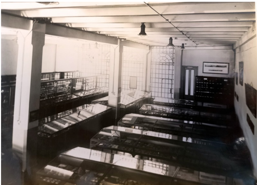
Figura 3. Vista interna. Museo de la Dirección de Minas, Geología e Hidrología. Circa 1940.

el catálogo figura: 1°) La lista de los minerales que componen la colección, ordenados según los caracteres químicos; 2°) Un catálogo instructivo destinado á [sic]servir de guía a través de la colección” (Hermitte, 1905, p. 17). A partir del año 1915, a la citada guía para las escuelas, le fue adjuntado dos planos elaborados por el geólogo Richard Stappenbeck, uno sobre “minerales de aplicación” y otro sobre “rocas explotables”, Memoria de la Dirección General de Minas, Geología e Hidrología (1915). Para el año 1931, el Museo había alcanzado a crear y distribuir más de cien colecciones de este tipo en el país anualmente. En la Memoria anual de 1958, pudimos encontrar que esta actividad con las escuelas se mantuvo de forma permanente durante esta primera etapa del Museo (Figura 3).