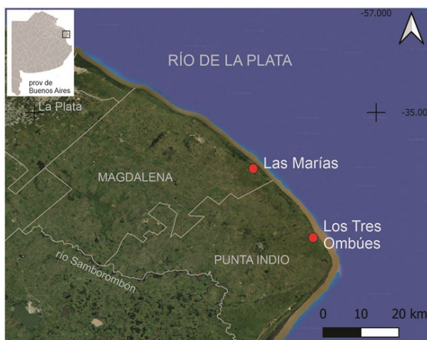
Figura 1. Localización geográfica de los sitios arqueológicos mencionados en el texto, Las Marías (partido de Magdalena) y Los Tres Ombúes (partido de Punta Indio).

El presente trabajo aborda una pequeña porción del registro fragmentario del sitio arqueológico Los Tres Ombúes, ubicado en la costa del Río de la Plata (partido de Punta Indio) (Fig. 1), con el objetivo de caracterizar la morfología de las piezas representadas mediante la reconstrucción virtual, para profundizar el conocimiento de la tecnología alfarera de los grupos humanos que habitaron el litoral rioplatense.