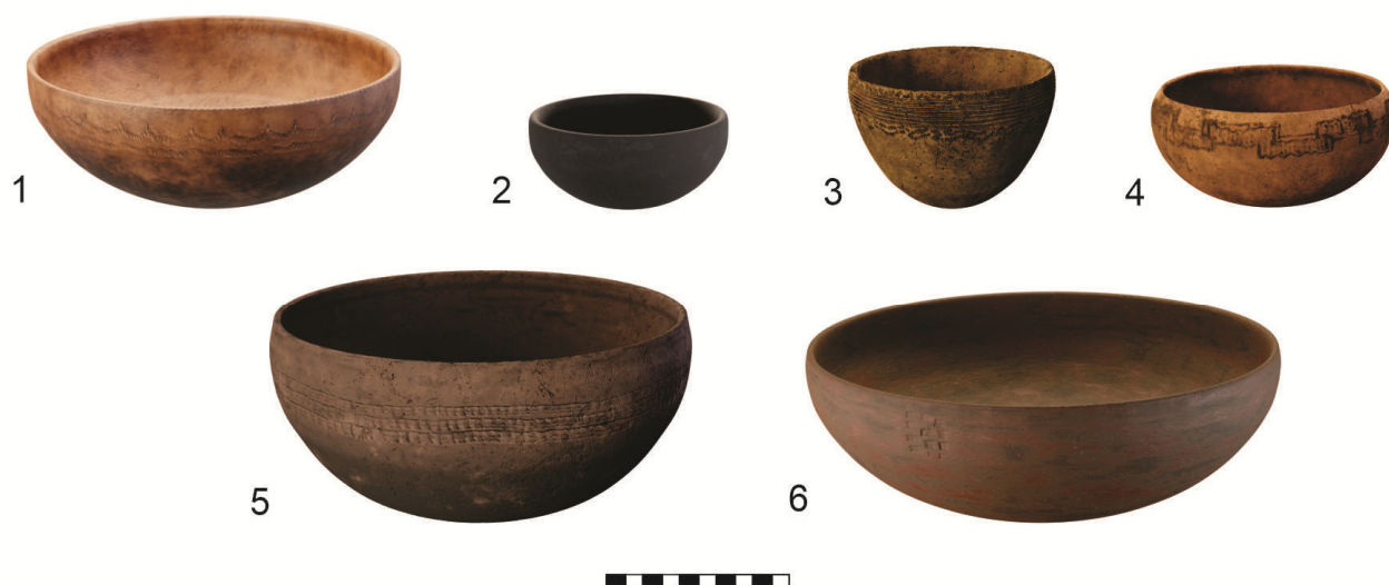
Figura 4. Reconstrucciones virtuales de las seis piezas cerámicas.

Cabe señalar que los modelos resultantes permitieron obtener imágenes de alta calidad, así como un video también realizado en Blender que muestra las seis piezas, que brinda una vista rápida de la variedad de formas y tamaños representados, disponible en el canal de Youtube de Arqueología Rioplatense 1 . Asimismo, los modelos tridimensionales están disponibles en la plataforma Sketchfab 2 . Estos recursos podrán ser incorporados en acciones vinculadas con la comunicación científica y la socialización de las tareas realizadas por el equipo de investigación, por ejemplo en cartelería vinculada a exhibiciones museográficas y en las redes sociales 3 .