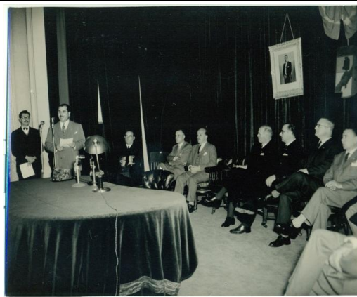
FMA0012 / FMA0014