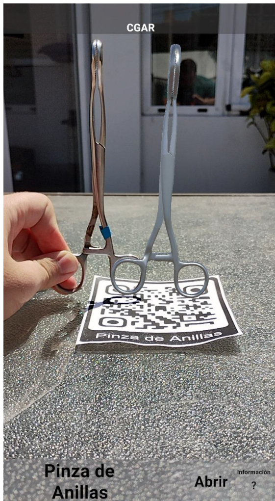
Figura 2. Prototipo móvil 3D de asistencia a estudiantes de veterinaria. Visualización de una herramienta real junto a la herramienta aumentada a escala.