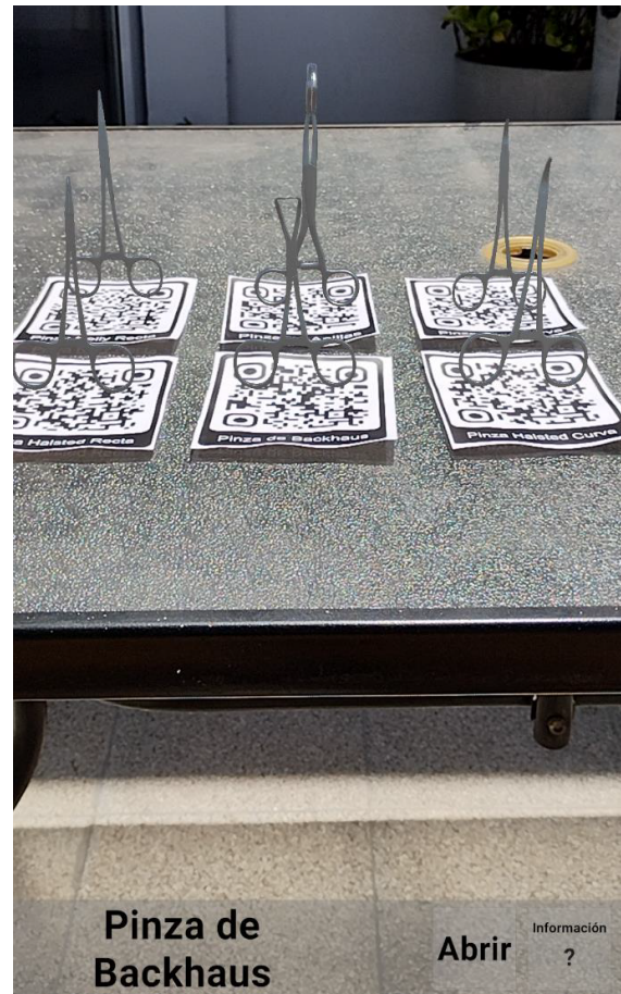
Figura 3. Prototipo móvil 3D de asistencia a estudiantes de veterinaria. Visualización del set completo de herramientas.