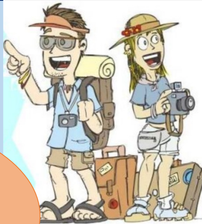
Requerimientos de los Turistas