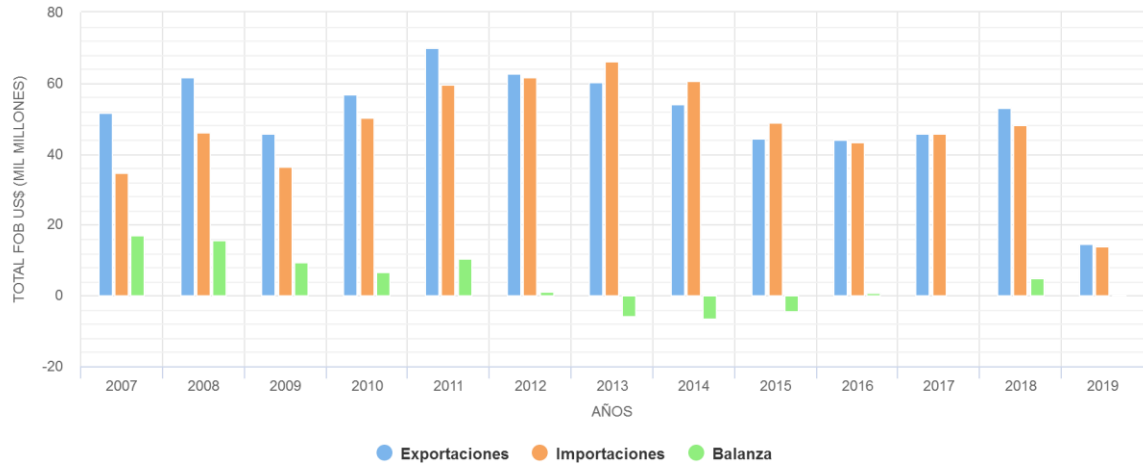
Cuadro 1 Exportaciones, Importaciones y Saldo MERCOSUR-UE 2007-2019