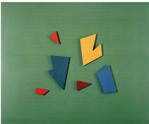
Fig n° 2 Pintura n° 171 (1948)