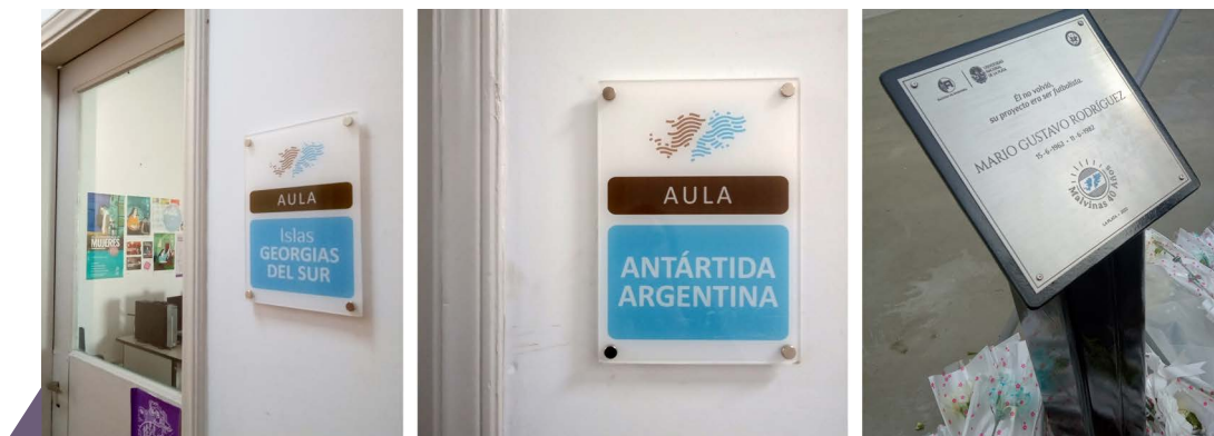
Imagen 5. Aplicaciones.

Este proyecto [Figura 5] tiene como objetivo visibilizar cómo el Diseño en Comunicación Visual puede participar y potenciar la naturaleza de las políticas públicas que rescatan conceptos como la recuperación histórica y la memoria, el interés en nuestros recursos naturales y estratégicos y la defensa de nuestra soberanía territorial y simbólica.