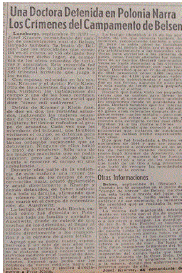
artículo de La Prensa referido al testimonio de Ada Bimko en el Juicio de Lunenburg Fuente: La Prensa , 29 de septiembre de 1945, p. 3.