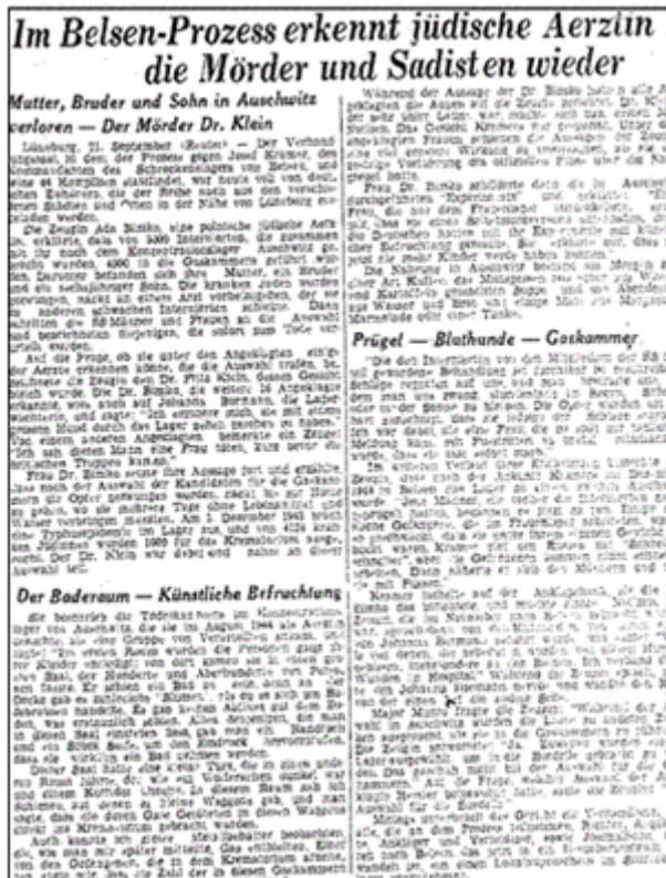
Fuente: Argentinisches Wochenblatt , 22 de septiembre de 1945, p. 1.