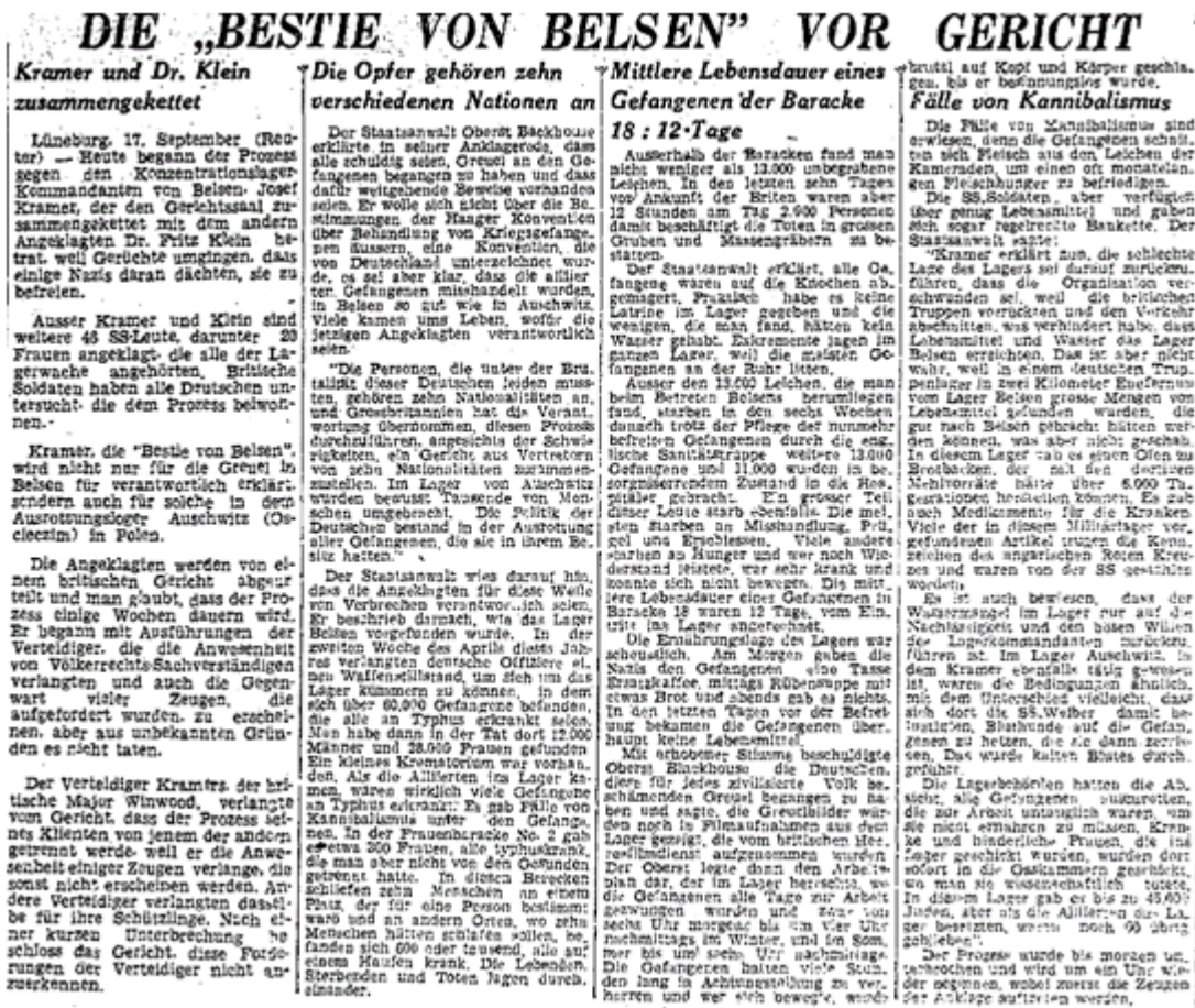
Fuente: Argentinisches Wochenblatt , 22 de septiembre de 1945, p. 3