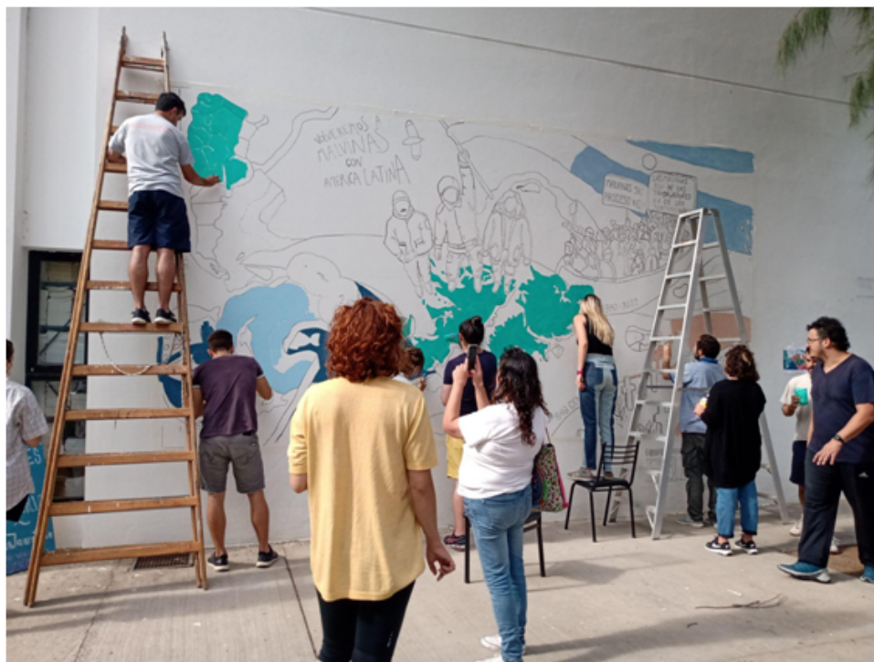
IMAGEN 3 Pintura colectiva del mural, 8 de abril de 2022