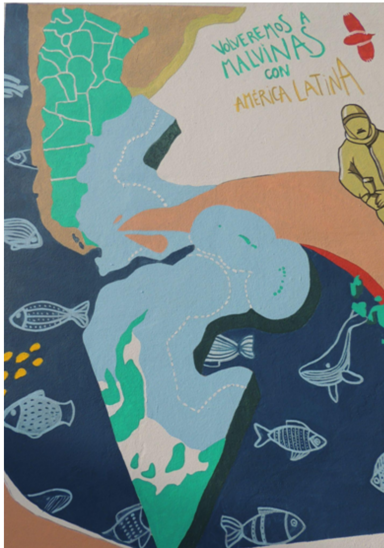
IMAGEN 6 Detalle del mural. Mapa bicontinental.

En el cuadrante superior derecho, se ubica un grupo de personas que materializa la presencia del pueblo. Algunas de estas figuras portan carteles, cuyas consignas “Malvinas Sí! Proceso No!” y “Las Malvinas son de los trabajadores, no de los torturadores” fueron tomadas de los carteles utilizados en la movilización del 10 de abril de 1982. En este sentido, la incorporación al mural de este grupo pone de relieve expresiones populares poco visibilizadas, que dieron cuenta del reclamo soberano, denunciando a su vez el Terrorismo de Estado.