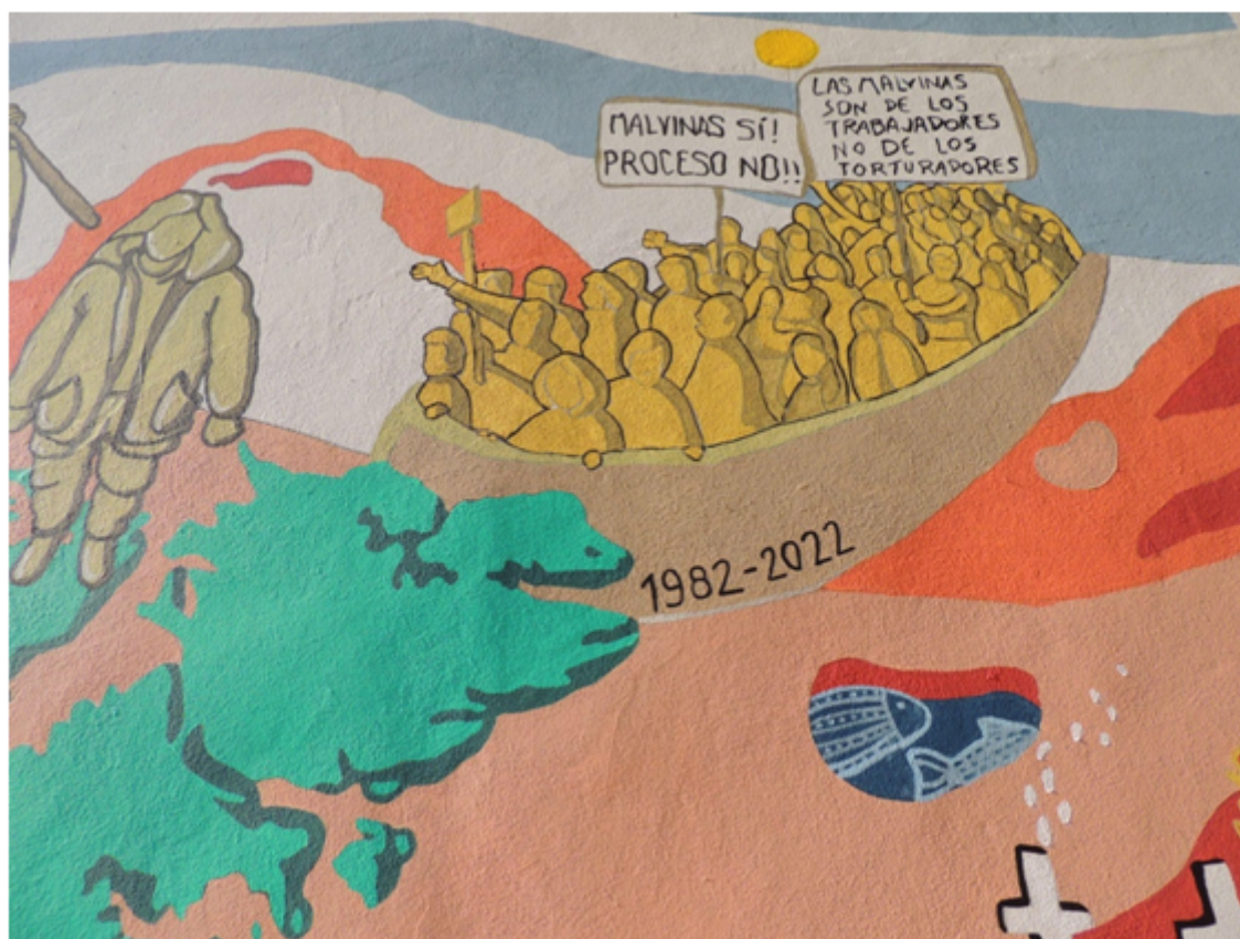
IMAGEN 7 Detalle del mural.

Por último, y por debajo de este, pueden verse unas cruces que aluden al Cementerio de Darwin, y la leyenda “649 centinelas.” Siguiendo con lo propuesto por el equipo, estos elementos representan el compromiso con la Memoria de los caídos en la Guerra del Atlántico Sur, “independientemente de que su muerte se haya producido en la tierra, en el mar o en el aire”. La inscripción “649 centinelas” busca homenajear a los caídos asignándoles un rol activo “como custodios de nuestra soberanía, enlazando ese reconocimiento con el compromiso de nuestra sociedad para con ellos y para con la Causa por la que perdieron sus vidas.”