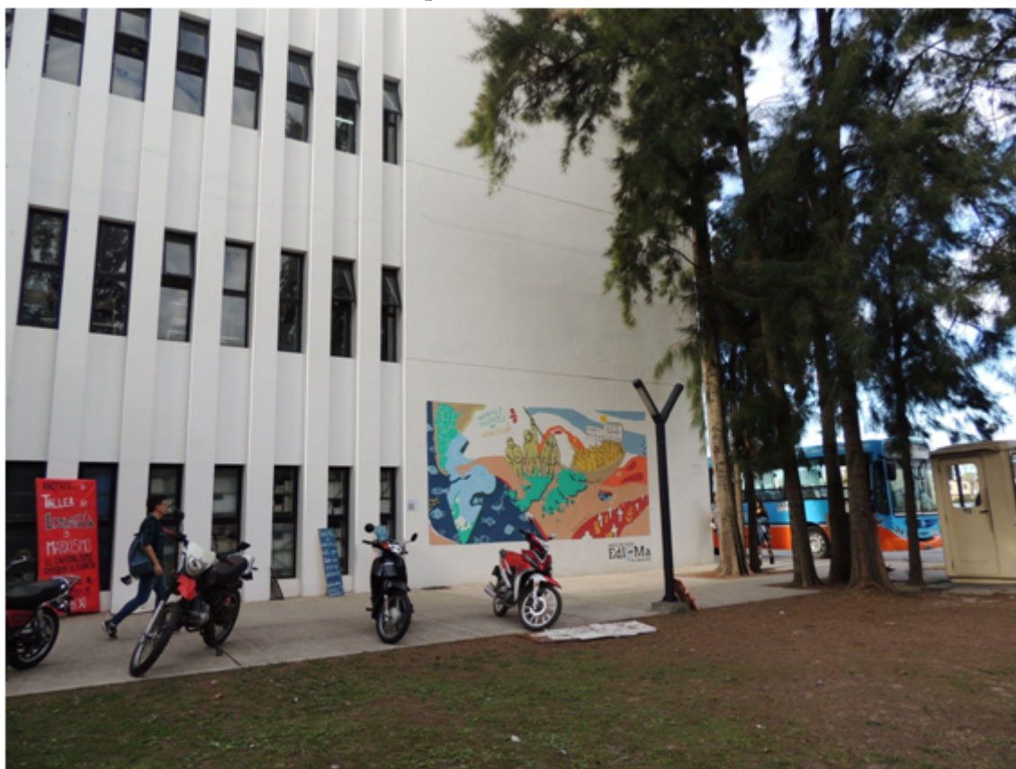
IMAGEN 8 Vista panorámica del mural.

Por otra parte, la presencia del mural en el predio del ex Batallón de Infantería de Marina 3 (BIM3) se torna aún más significativa, teniendo en cuenta que desde este sitio fueron enviados soldados, en su mayoría conscriptos, a la guerra. Algunas huellas de aquella experiencia pueden hallarse en el archivo digital público de la red social Facebook denominado “Grupo BIM 3”. 2 Allí se recuperan recuerdos y memorias individuales/colectivas sobre el pasado de los infantes de marina y ex-conscriptos que realizaron la colimba en el predio. Cabe destacar que entre esos relatos, la Guerra de Malvinas es un tema recurrente. Tal como señalaron Jean Jean y Rosas (2016) en el mismo “existe una intencionalidad dirigida a reconstruir “una memoria” del BIM 3 a partir de la suma de los recuerdos personales de quienes prestaron sus servicios en el Batallón (...) resaltando el papel cumplido por el BIM 3 en la Guerra de Malvinas” 3 (p.5). Las fotografías que forman parte de ese acervo documental brindan información sobre el funcionamiento del Batallón, hay imágenes que reponen situaciones de su cotidianidad, y dan cuenta de los preparativos para viajar a Malvinas (imagen 9) y así como también capturan momentos del día a día de los ex conscriptos en las Islas (imágenes 10 y 11).