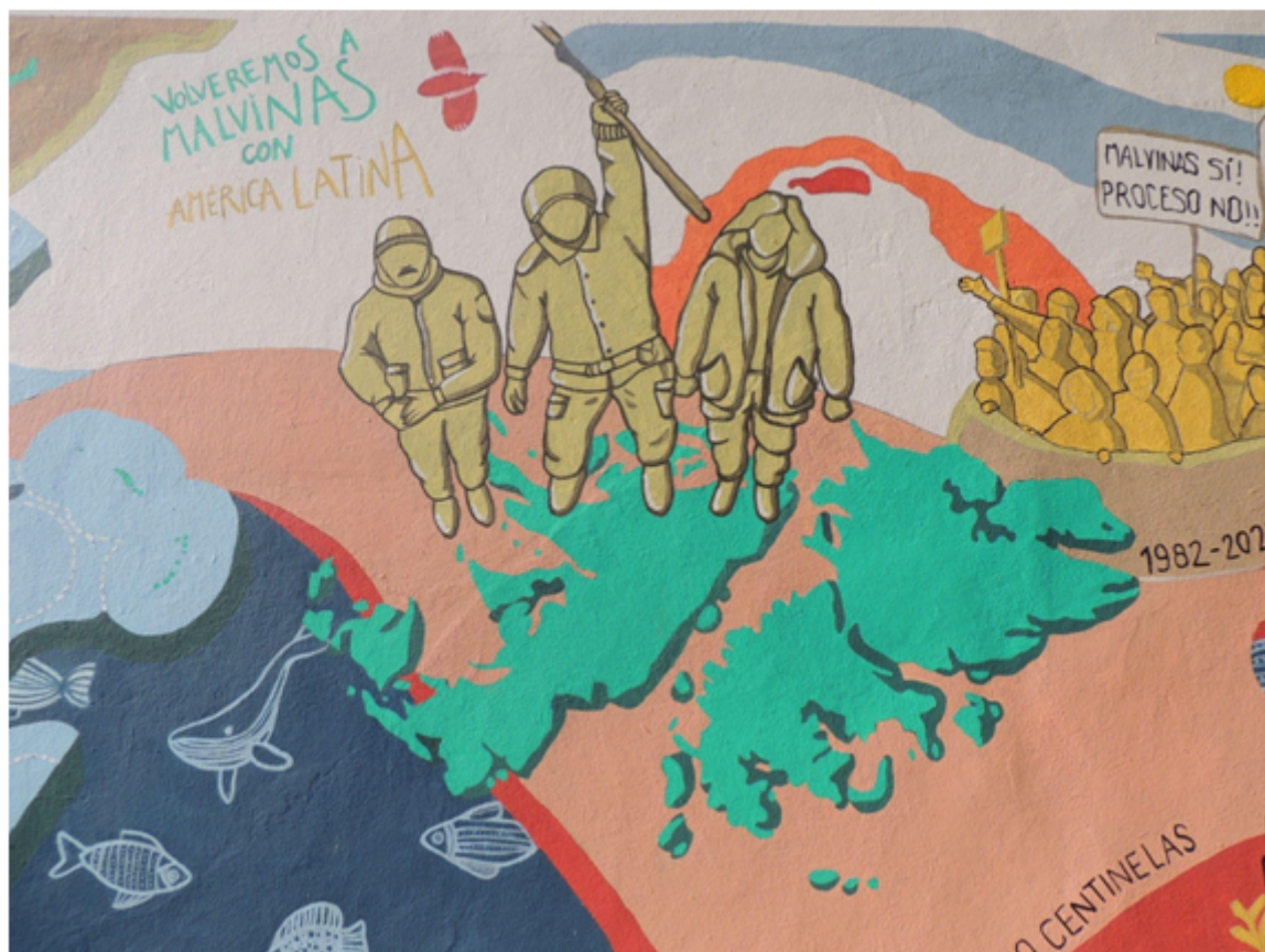
IMAGEN 5 Detalle del mural