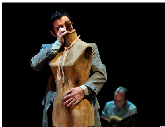
Registro fotográfico de la función de estreno. Escena El cortejo, Teatro Anfitrión, 2016.