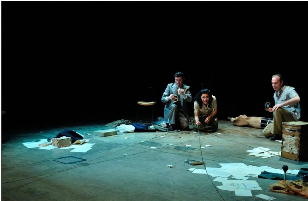
Escena "La delegada" - Material de registro fotográfico de la función de estreno de la obra.