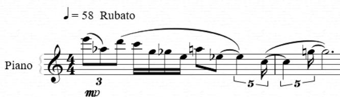
Línea melódica presente en A

En la melodía se observa una línea quebrada con dirección descendente, que recupera cierto equilibrio en un salto ascendente final. El movimiento está constituido, a su vez, por saltos predominantemente descendentes y descensos cromáticos, interrumpidos por tres movimientos de salto contrario. Desde el punto de vista rítmico, se imprime un tiempo inestable, producto de la utilización de figuras de valor irregular, el uso de síncopas y la interpretación de tempo rubato. El resultado es una melodía en la que se percibe cierto desequilibrio e inestabilidad, sin centro tonal, sin pulsación fija. Intenta de ese modo acompañar el clima y los gestos de la escena, poniendo en juego los conceptos de “inestable”, “flotante” y “declive” que se esperaban lograr.