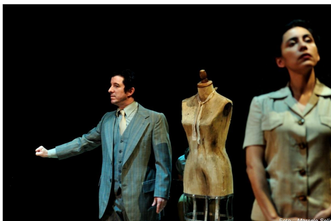
Registro fotográfico de la función de estreno. Escena "Encuentro", Teatro Anfitrión, 2016.