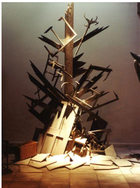
Tom Criswell (2012) Recycled Wood. Escultura en madera. Imagen de la obra compartida por la directora como de referencia para el trabajo de Arte, creación de objetos e iluminación