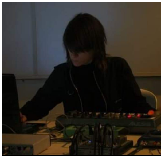
Registro fotográfico de la función de estreno. Teatro Anfitrión, 2016.