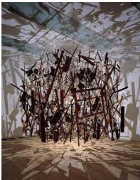
Cold Dark Matter: An Exploded View (1991), Instalación de Cornelia Parker. Imagen de la obra compartida por la directora como imagen de referencia para el trabajo de Arte, creación de objetos e iluminación